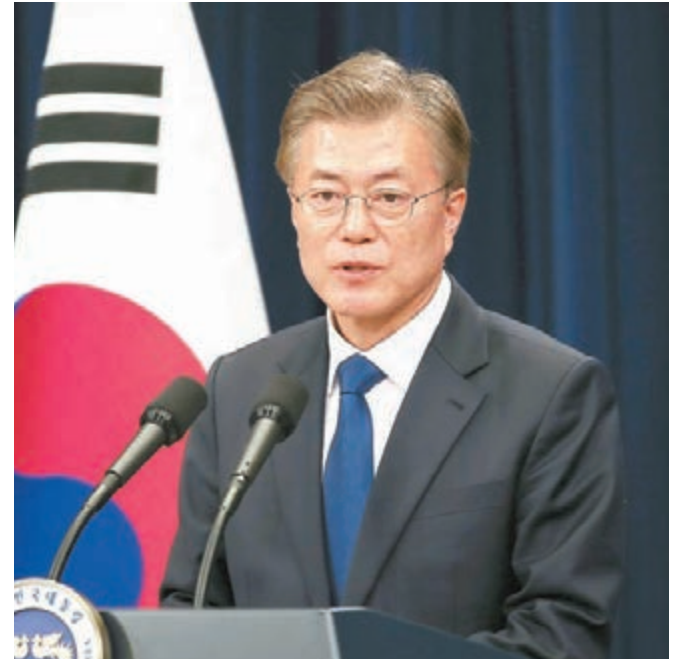
新任韓國總統文在寅表示,願攜手中方早日啓動六方會談。 中共中央總書記、國家主席習近平與文在寅通話表示,堅決反對「薩德」入韓。