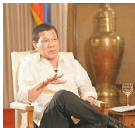
菲律賓總統杜特爾特 可能不會涉及具體問題,但將反映去年10月菲律賓總統杜特爾特訪問北京時與中方簽署的聯合聲明。

同時,參考消息網11日援引新加坡媒體消息稱,中國和菲律賓預計本月簽署一項有關南中國海安全與合作的協議,以便能和平共用兩國在南中國海存在主權爭議的海域。中菲有關南中國海的第一個協議