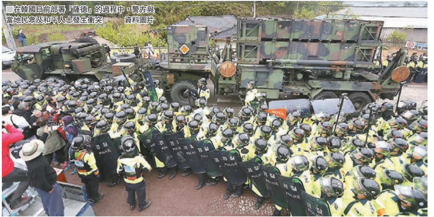
在韓國日前部署「薩德」的過程中,警方與當地民眾及和平人士發生衝突。