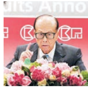
■李嘉誠重申,自己愛香港、有感情,計劃在香港終老,稱隨時可以退休。

指前景不太明朗而未敢退休,現時會否考慮退下來?李嘉誠指,自己「隨時退休都得,Victor(李澤鉅)同所有執董,我退休佢哋會繼續做,Victor頂替我嘅位置,公司亦成熟,如無意外,對公司前途充滿信心,大家放心,我退休無大影響。」