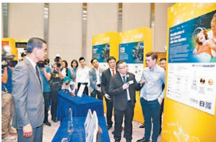
■梁振英昨出席在添馬政府總部舉行的第四十五屆日內瓦國際發明展得獎者慶祝酒會,並參觀展覽。

梁振英昨日在慶祝酒會致辭時指出,今屆國際發明展有來自40個國家和地區、超過720個發明家參與,展出超過1,000項創新產品,競爭激烈。香港參展團隊能夠從中脫穎而出,取得歷來最佳成績,實在不容易。本港獲獎團隊涵蓋產、學、研界別,包括科學園內的科技公司、理工大學及浸會大學的代表隊、生產力促進局等,得獎作品範疇遍及醫療科技、新電子物料、汽車安全系統、機械工程及新紡織材料等。