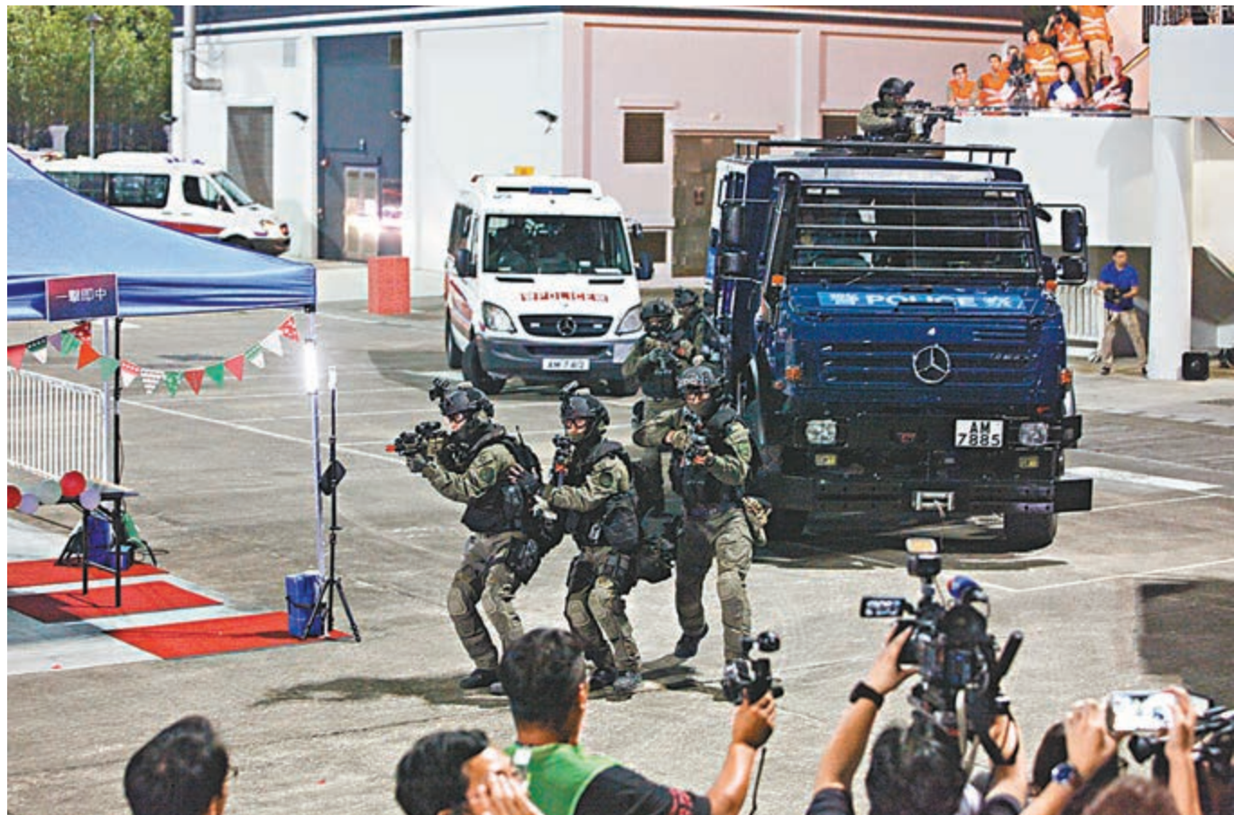
警方精銳盡出，參與「堅盾」反恐演習。

謝振中強調，本港目前無情報顯示香港受恐襲威脅，恐襲風險維持於中度，警方不會掉以輕心，並會繼續與各地交流反恐最新情況和相關情報。