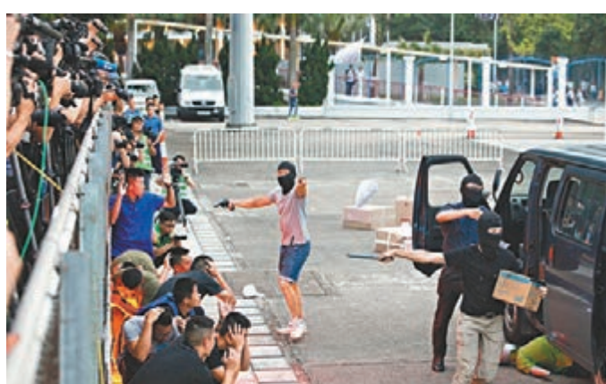
演習模擬恐怖分子脅持人質。