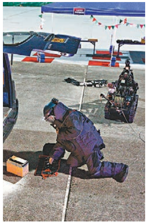
拆彈專家到場，並出動拆彈車。