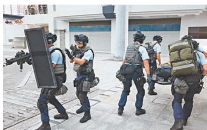
「堅盾」反恐演習測試及提升警隊的反恐能力。