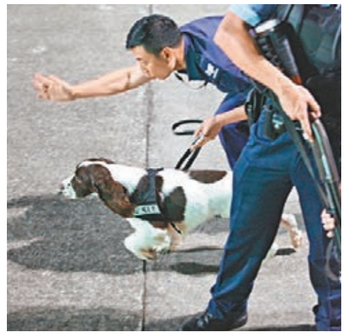
演習出動警犬協助，在恐怖分子棄置的客貨車上發現炸彈。