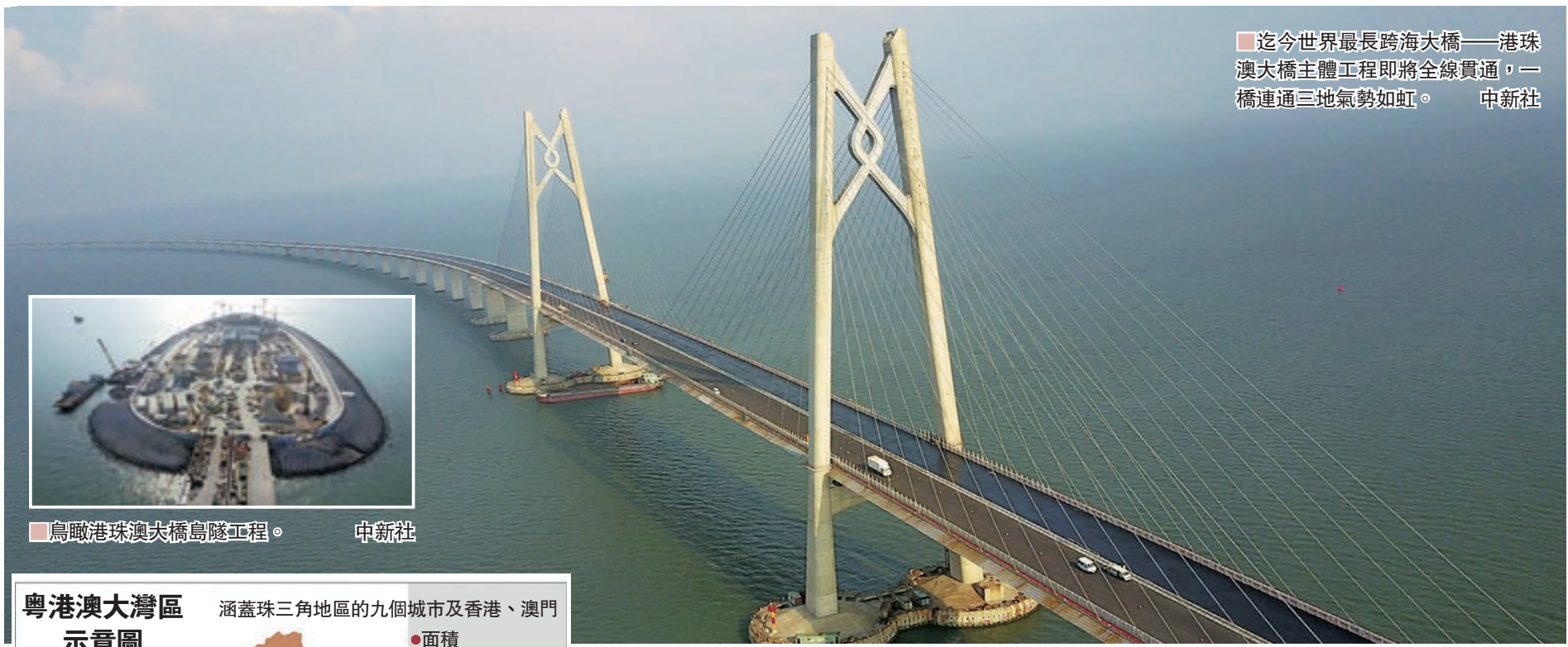
迄今世界最長跨海大橋——港珠澳大橋主體工程即將全線貫通，一橋連通三地氣勢如虹。