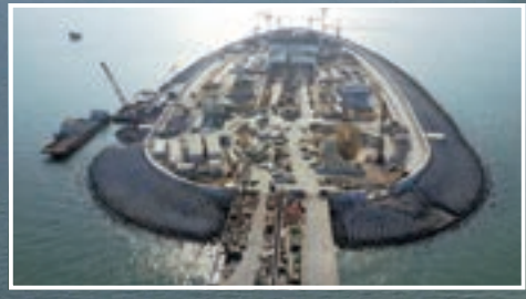
鳥瞰港珠澳大橋島隧工程。