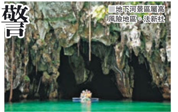
地下河景區屬高風險地區。