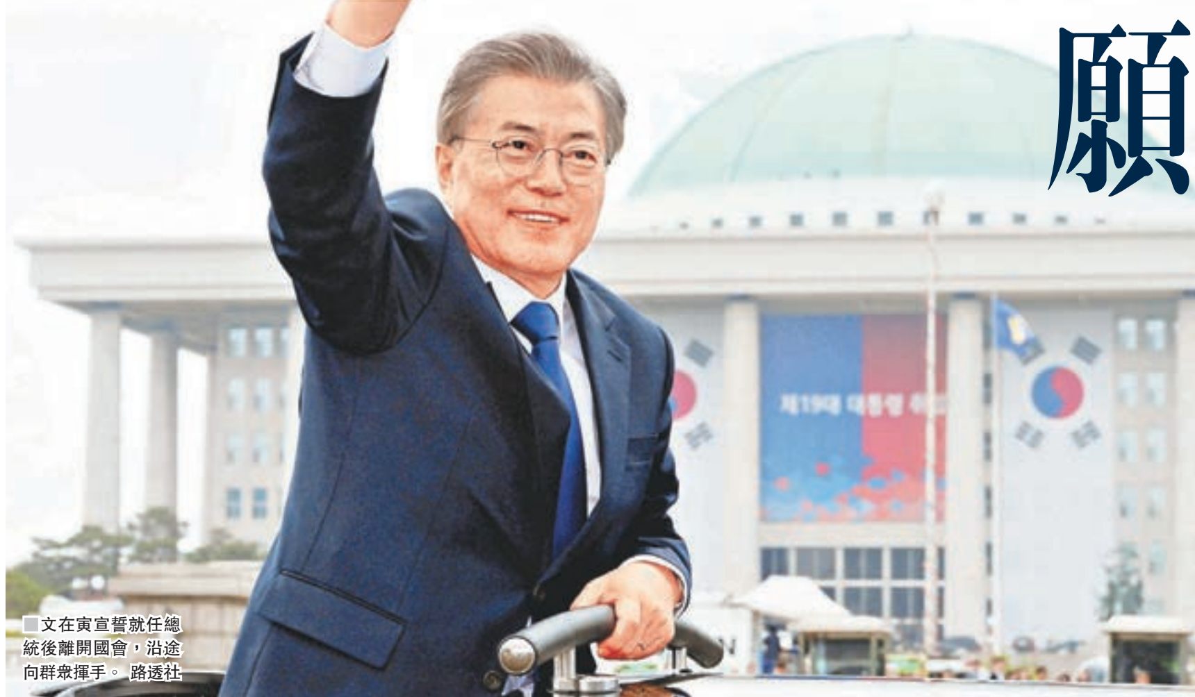
文在寅宣誓就任總統後離開國會，沿途向群眾揮手。

韓國新總統文在寅昨日正式宣誓就任，展開5年任期。他誓言上任會即時處理朝鮮核問題，必要時可以為了半島和平訪問華盛頓、北京和東京，甚至願意在條件許可下訪問平壤。他又表示將與美國及中國磋商，解決「薩德」導彈防禦系統引起的爭議。文在寅並兌現選舉承諾，稱只要一切準備就緒，便會把總統府由青瓦台搬到光化門政府大樓，成為「光化門總統」。