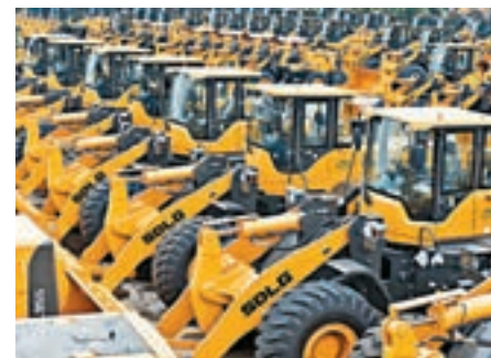
4月工業生產者出廠價格指數環比下降。圖為山東臨工工程機械有限公司裝載機存放區。

交行首席經濟學家連平表示, 由於PPI環比漲幅連續放緩, 近期出現負增長, 2月份同比漲幅可能是全年高點。工業生產者購進端價格同比漲幅已經連續5個月超過出廠產品價格漲幅, 抬升企業生產成本, 對中下游行業利潤增長形成制約。隨着企業補庫存周期逐漸走弱, 疊加翹尾因素下降的影響, 未來PPI漲勢可能繼續放緩。