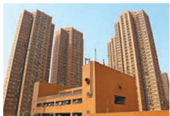
兆康苑面積548方呎的中層單位以480萬元(已補價)成交,創屋苑歷史新高紀錄。

方呎,屬三房套間,原業主先以1,680萬元放盤,及後加價40萬元,最終以1,720萬元將單位易手,折合呎價18,655元。原業主於2014年4月以1,240萬元購入單位,持貨滿3年剛過額印稅SSD期限,賬面獲利480萬元,單位升值39%。