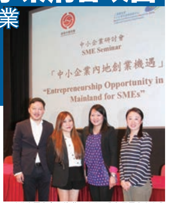
香港中國商會日前聯同香港工業貿易署中小企業支援與諮詢中心在港舉辦了「中小企業內地創業機遇」研討會

行種子投資、天使投資、股權投資、風險投資，並引進證券機構、保薦機構，推介戰略合作夥伴，邀請投資銀行、會計師事務所、律師事務所等加入，提供包括進行前期輔導、推介等專業服務，促進優質企業進入資本市場直接融資，以利擴大生產和長足發展。此次研討會約共150人出席會議，會上討論熱烈，與會者會後亦與講者深入交流。