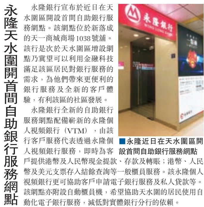
永隆銀行近日在天水圍區開設首間自助銀行服務網點

在本次發布會上，錢方好近正式發布了「好近智慧支付雲」，以應對未來行業的挑戰。好近智慧支付雲整合了聚合支付、生意王智慧會員SaaS、廣告流量變現、自有品牌展示、多級管道拓展、智慧數據管理與運營、金融、深度對接八大能力，最大程度地賦能全行業各個角色的合作夥伴。不僅可以開放多個API，提供完善、優秀的基礎服務能力，還可以根據合作夥伴的角色、能力提供不同合作方案。無論是銀行、金融機構、支付服務商、創業公司、個人，都可以快速進入到支付產業生態鏈的各個環節，給用戶提供安全、穩定、便捷的支付服務，共同打造支付世界。