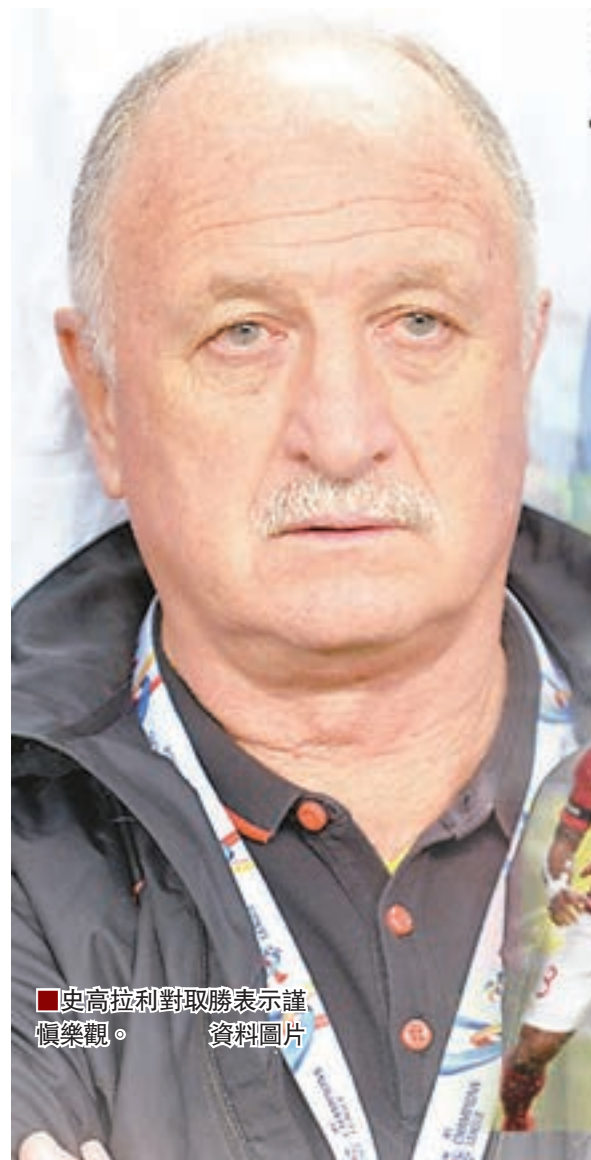
■史高拉利對取勝表示謹慎樂觀。