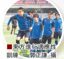
■東方進行適應性訓練。