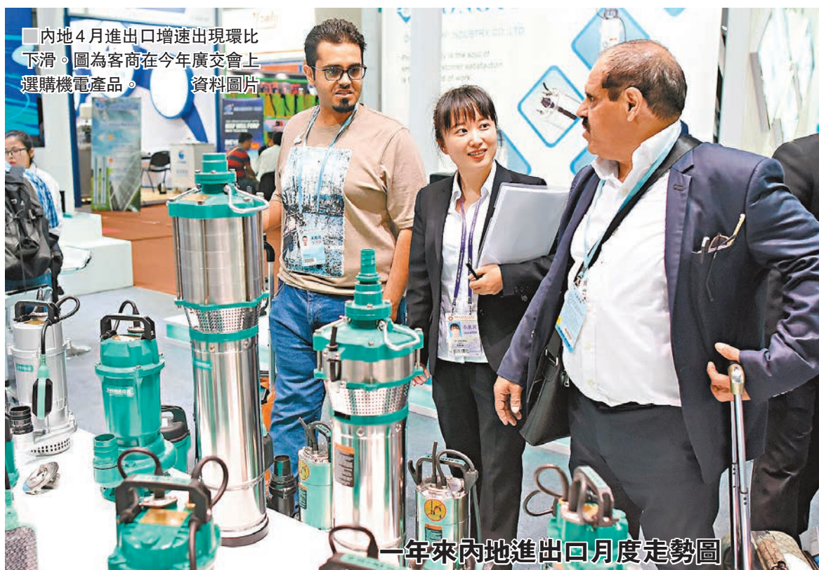
內地4月進出口增速出現環比下滑,圖為客商在今年廣交會上選購機電產品。資料圖片

對於今後外貿走勢,4月海關總署的外貿出口先導指數為40.7,較上月回升0.5。但白明分析認為,從外部環境看,特朗普上台後對華貿易政策還未知;內地企業經營成本上升,削弱競爭力;東南亞製造業等對中國出口衝擊愈加嚴重,出口形勢或面臨挑戰。總體判斷,內地經濟增長對外貿的溢出效應已經到了一個平台階段,未來可能表現為低速、穩定增長態勢。