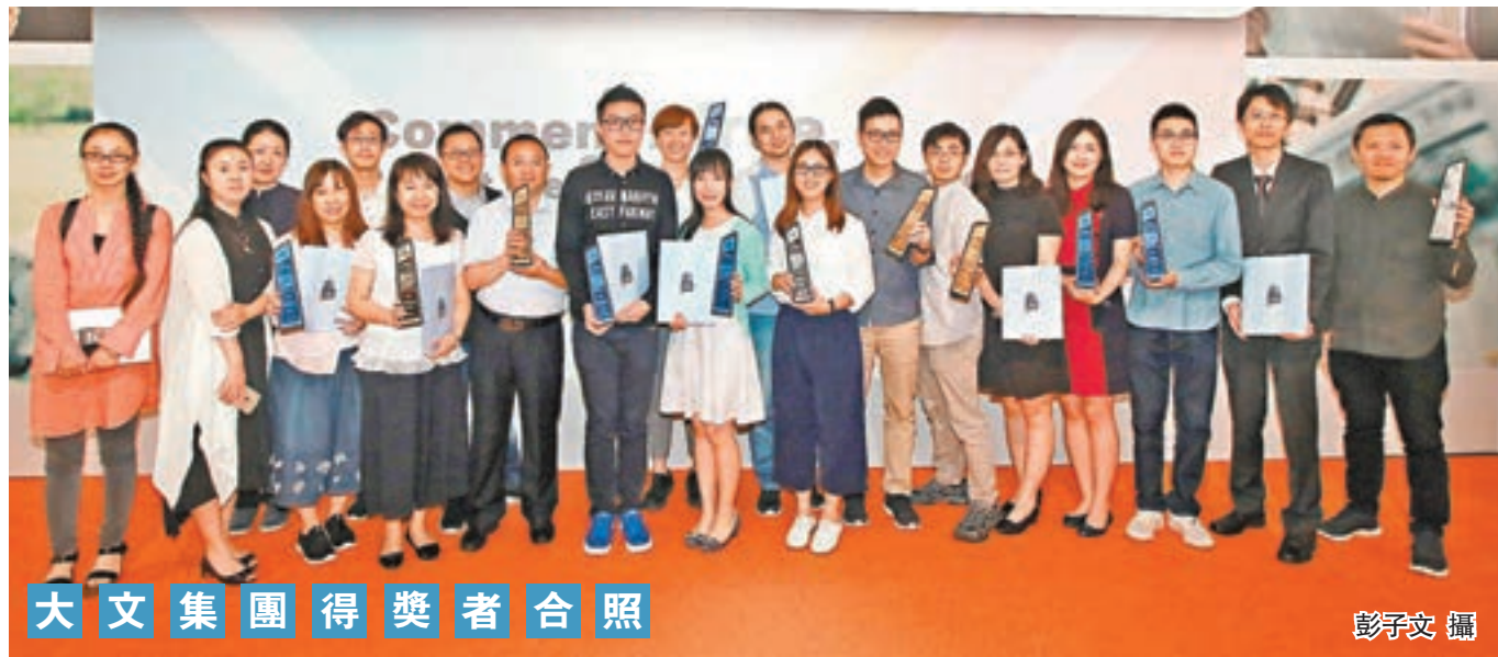
大文集團得獎者合照