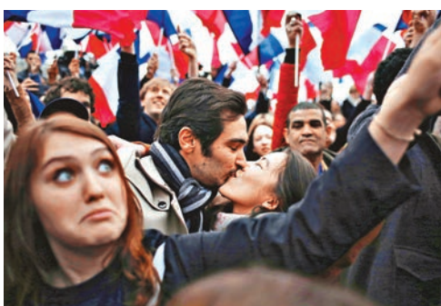
■馬克龍支持者甚為興奮，並親吻慶祝。