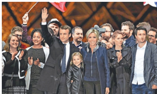
■特羅尼厄的子女及孫女等為馬克龍慶祝。

及美國大選中揚威後，如今終在法國受挫，因此感到自豪。歐洲各地自由派亦大感鼓舞，形容奧地利、荷蘭和法國的選舉結果，就像自由派「3比0」擊敗民粹反全球化勢力，寄望這可以成為推翻民粹思潮的起點。