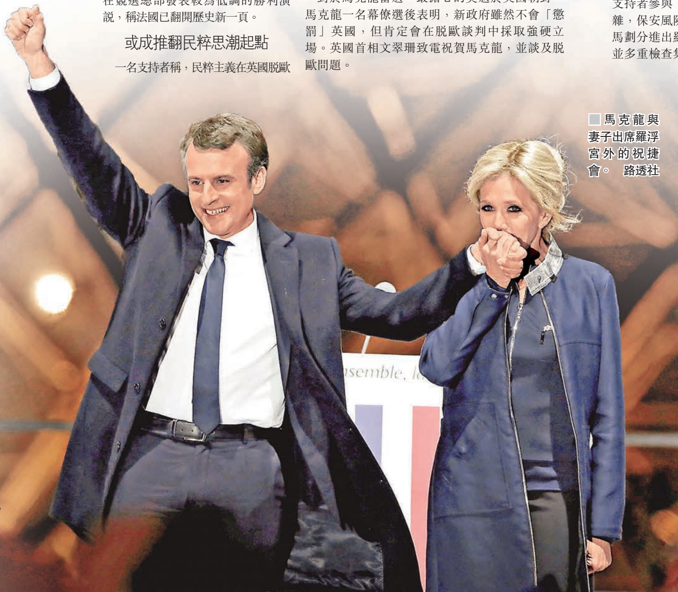
■馬克龍與妻子出席羅浮宮外的祝捷會。

對於馬克龍當選，最擔心的莫過於英國朝野，馬克龍一名幕僚選後表明，新政府雖然不會「懲罰」英國，但肯定會在脫歐談判中採取強硬立場。英國首相文翠珊致電祝賀馬克龍，並談及脫歐問題。