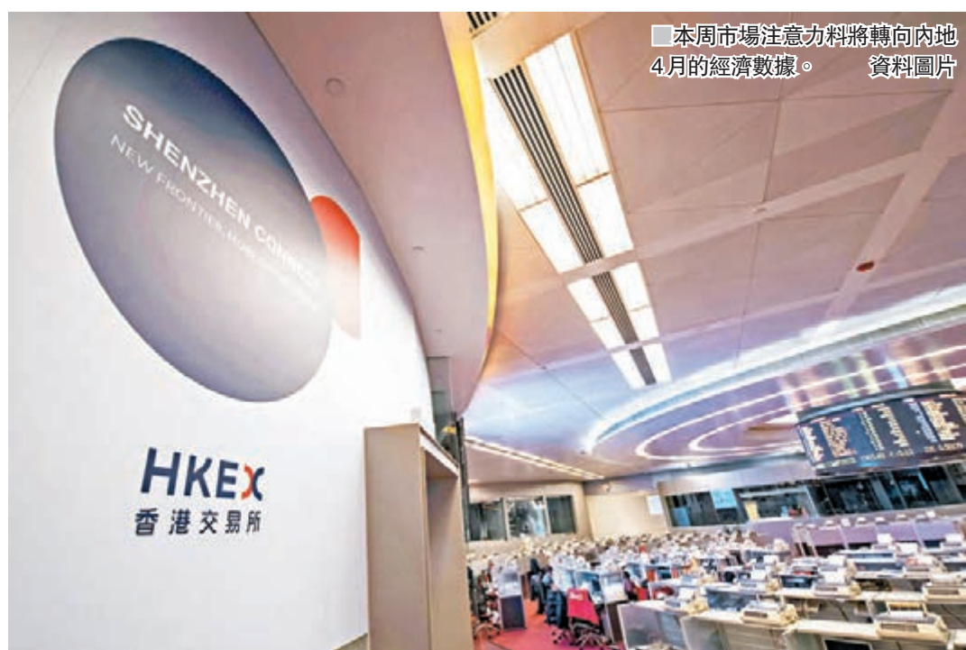
■ 本周市場注意力料將轉向內地4月的經濟數據。資料圖片

他續指,本月14日至15日,內地將舉辦「一帶一路」國際合作高峰論壇,料基建股或有炒作機會。需注意的是,內地資金面是否緊張,有機會對內銀股繼續形成拖累。早前銀監會主席郭樹清警告,要注意房地產相關貸款,已佔銀行業總貸款三分之一,個別銀行甚至超過一半。沈振盈認為,銀行直接與房地產相關貸款即使是三分之一的平