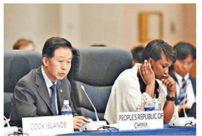
肖捷(左)出席亞洲開發銀行理事會年會並發言。

會議期間，肖捷還會見了亞開行行長中尾武彥，就亞開行支持「一帶一路」建設、中國與亞開行合作等議題交換了意見。