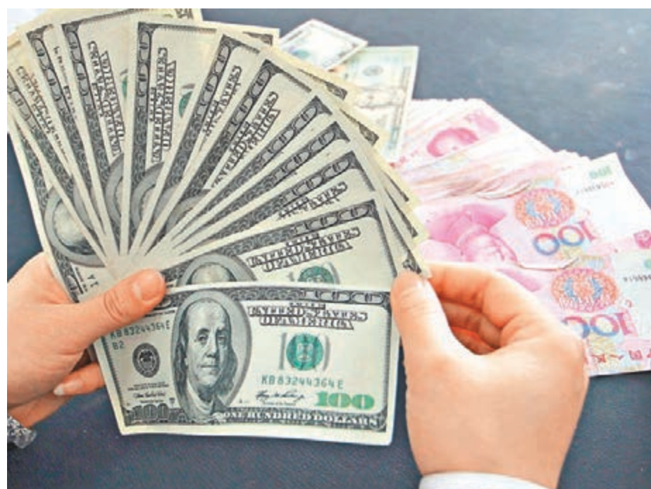
市場預計，中國短期外匯儲備規模將趨向穩定。圖為內地一家銀行的工作人員在清點美元。

國家外匯局有關負責人解釋4月外匯儲備超預期上升的原因時稱，中國跨境資金流動在4月繼續向均衡狀態收斂，外匯供求趨向基本平衡；國際金融市場上，非美元貨幣相對美元總體升值，資產價格有所上升。這些因素綜合作用，推動了外匯儲備規模的回升。