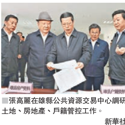
張高麗在雄縣公共資源交易中心調研土地、房地產、戶籍管控工作。

性詳細規劃、白洋淀生態環境保護和治理規劃及各專項規劃，推動「多規合一」。要突出生態優先、綠色發展，加強白洋淀生態環境治理和保護，提高產業準入門檻，建設綠色、森林、智慧、水城一體的新區，着力打造生態城市標杆。要用新發展理念引領新區發展，發展高端高新產業和服務業，加快體制機制創新，提高公共服務水準，促進人口資源環境協調發展，努力打造創新驅動引領區和協調發展展示範區。