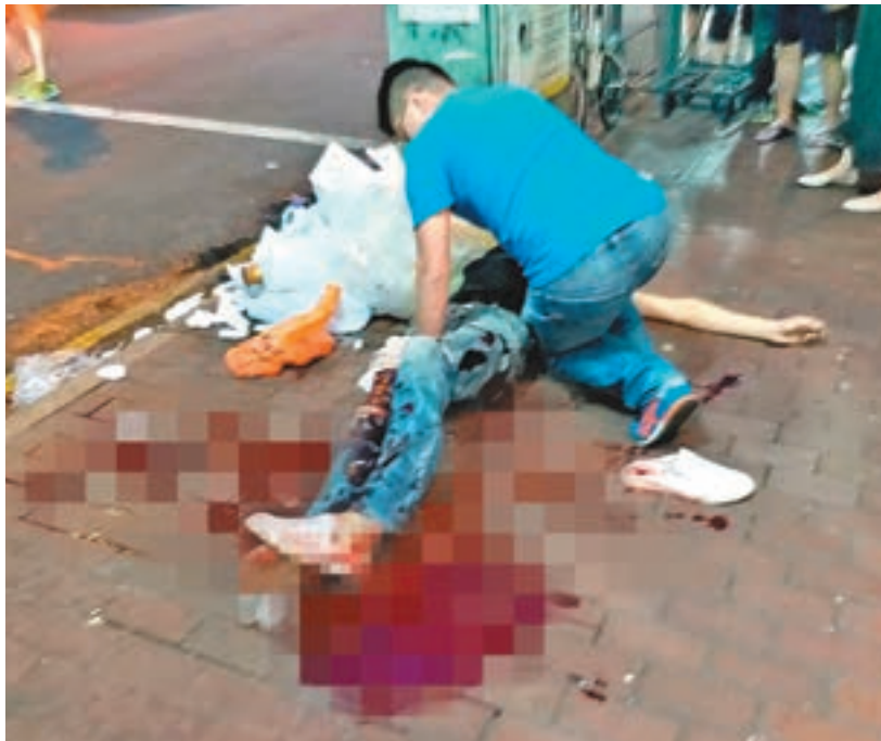
傷者浴血躺臥街頭，有熱心男途人替事主按住腿部傷口止血。

事後大批警員在附近兜截刀手，又一度封鎖附近一座疑有刀手匿藏的大廈，並持盾牌登樓搜查，惜最終無發現兇徒，僅在梯間檢獲一柄懷疑涉案利刀。