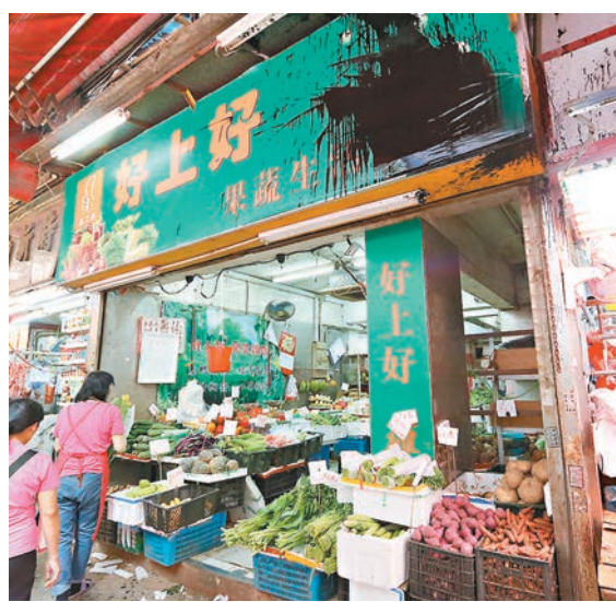
其中一間遭淋黑漆的新填地街菜店。