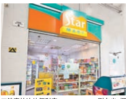
涉案的油站便利店。

香港文匯報訊（記者 杜法祖）一名蒙面刀匪，昨清晨闖入柴灣一油站便利店，以利刀指嚇職員聲稱劫劫，迅速掠去收銀機內5,100元逃走，油站一名六旬職員一度尾隨追截，惜至150米外終失去匪徒蹤影。警員事後一度兜截，惜無發現，現正根據油站「天眼」片段設法緝捕劫匪歸案。