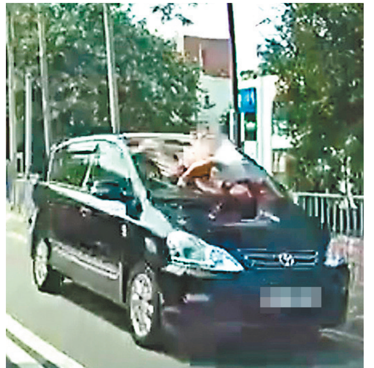
女途人倒伏車頭擋風玻璃後，七人車仍繼續開行。