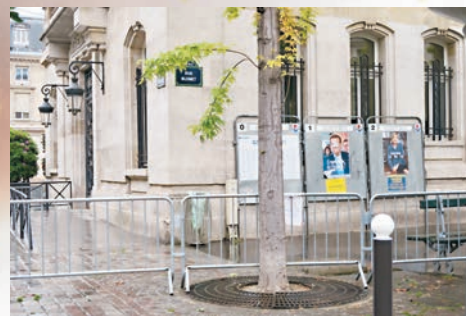
有票站門外昨日提前架起鐵馬。