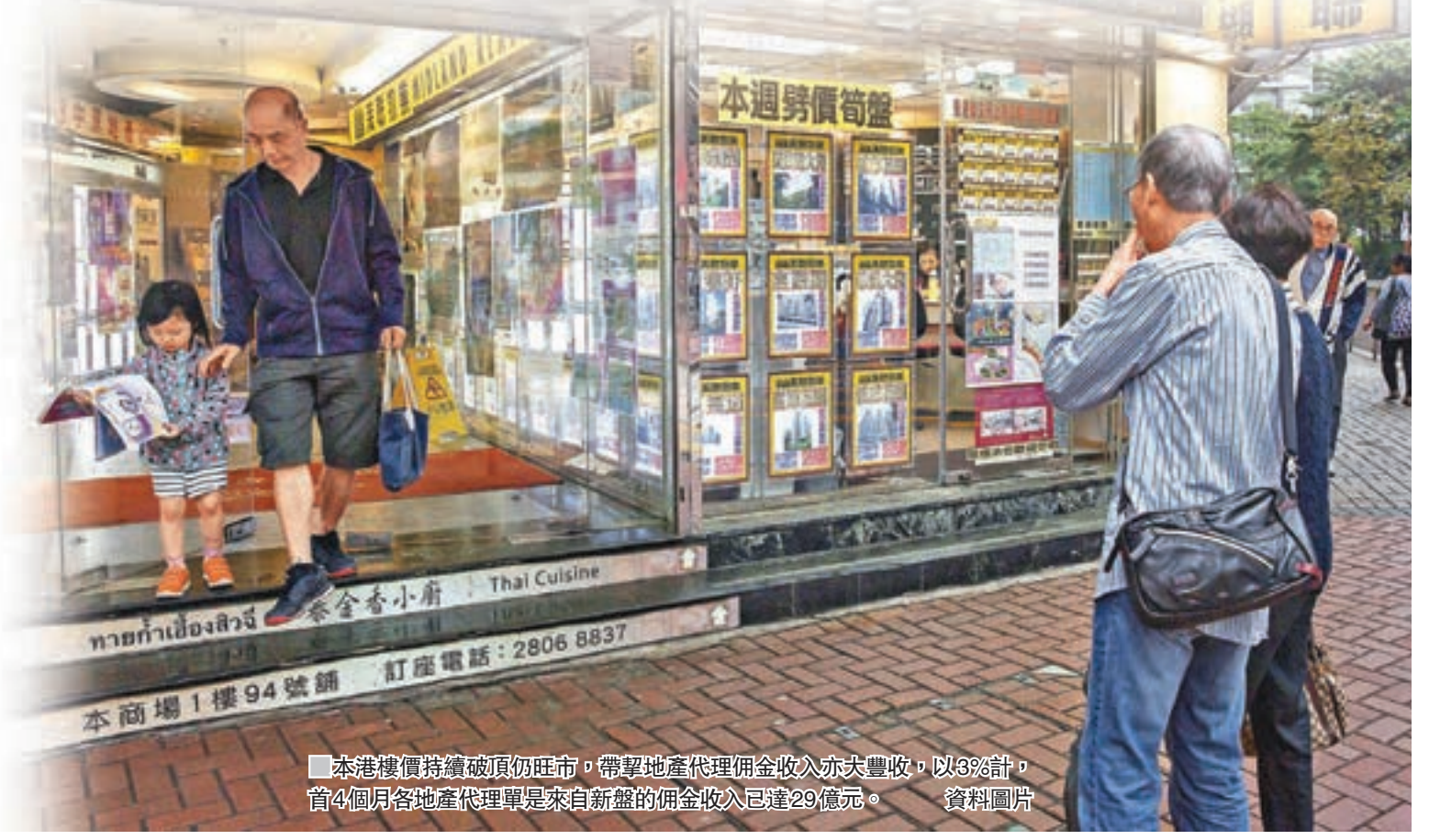
本港樓價持續破頂仍旺市,帶挈地產代理佣金收入亦大豐收,以3%計,首4個月各地產代理單是來自新盤的佣金收入已達29億元。

另外,今年首4個月土地註冊處整體物業成交錄27,424宗,按年升89%,平均每月成交量6,856宗。根據最新代理人數計算,即平均約每5.4名代理爭取一單成交,已比今年1月及2月7人爭一單成交為好。