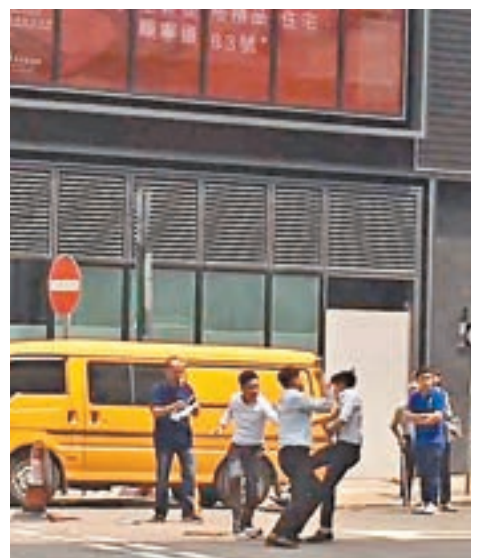
網傳有代理為爭客於售樓處外街頭鬥鬥。片段截圖

很多人以為代理收入高,百萬元薪不是夢!但真正成功的不到三成,大部分人收入不穩定。很多人曾經歷過在樓處附近的街道被地產代理包圍,他們甚至跳出馬路「攔車」(把車截停),有些在路邊派單張。其實地產代理每月只有約五千至六千元底薪,只夠搭車食飯,連租樓的錢都不夠,要做到