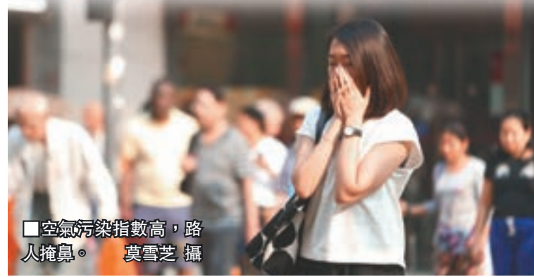
空氣污染指數高,路人掩鼻。

由韓國首爾來港旅遊的田小姐表示,香港空氣質素不佳,但勉強可以接受,卻有礙景觀,「一年前來過香港,海景也沒這麼朦朧。」她說,首爾空氣污染比香港更嚴重,韓國人平時上街,都一定會戴上口罩,因此對空氣問題已見怪不怪。她認為,若香港政府可以推出對策改善空氣質素,可以加強香港的旅遊吸引力。 ■記者 文森