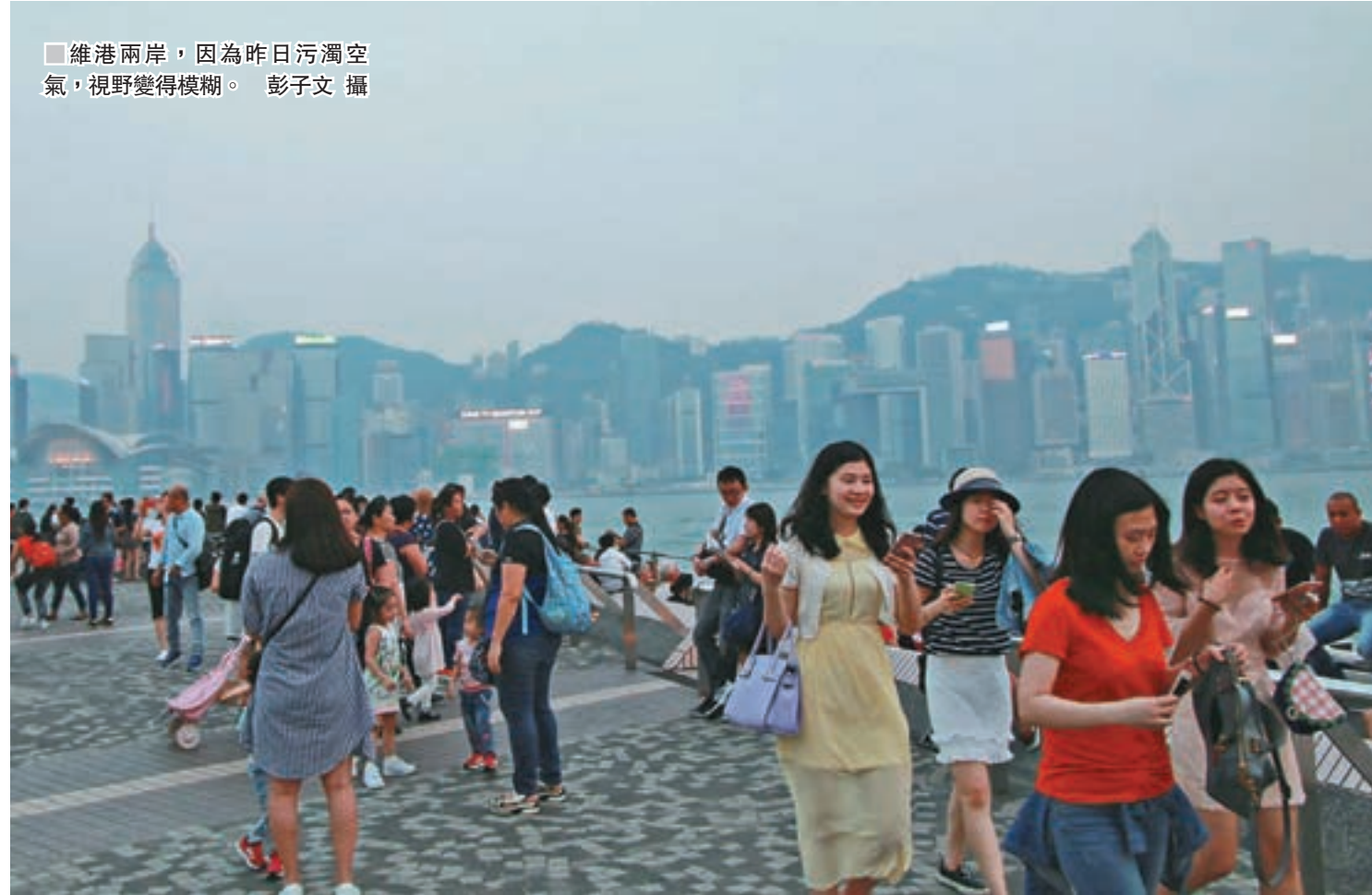
維港兩岸,因為昨日污濁空氣,視野變得模糊。