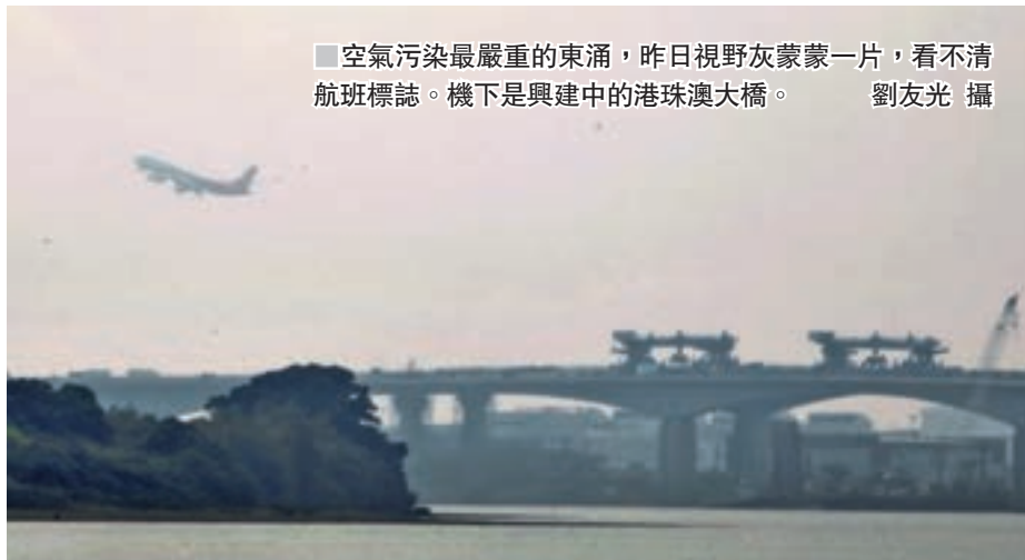
空氣污染最嚴重的東涌,昨日視野灰蒙蒙一片,看不清航班標誌。機下是興建中的港珠澳大橋。

環保署昨日公佈,本港錄得較正常為高的空氣污染水質。昨日下午,部分一般監測站的空氣質素健康指數錄得10+。