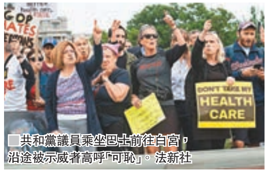
■共和黨議員乘坐巴士前往白宫，沿途被示威者高呼「可恥」。