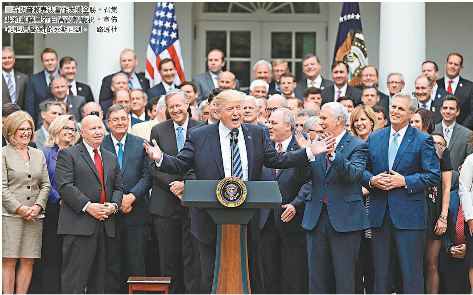
■特朗普將表決當作大獲全勝，召集共和黨議員在白宫高調慶祝，宣佈「奧巴馬醫保」的死期已到。

經過長達7年「抗爭」，美國共和黨前日終在國會眾議院以4票之差，通過新醫保法案，為推翻2010年通過的「奧巴馬醫改」邁進一大步，同時終於為總統特朗普送上就任百日以來，其中一項重大內政勝利。新醫保法案稍後將送交參議院審議，惟因共和黨在參院只有些微優勢，在部分共和黨參議員表明反對下，法案必須作出大幅修訂方有望獲得通過。不過特朗普已經將今次表決當作大獲全勝，召集共和黨議員在白宫高調慶祝，宣佈「奧巴馬醫保」的死期已到。