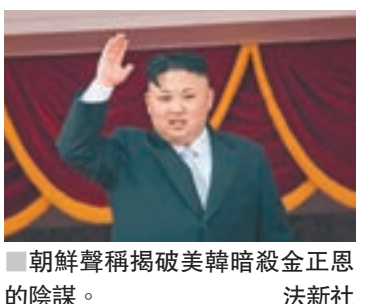
■朝鮮聲稱揭破美韓暗殺金正恩的陰謀。