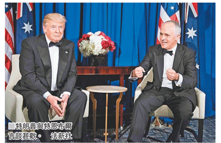
■特朗普與特恩布爾會談甚歡。

美國總統特朗普與澳洲總理特恩布爾前日在紐約會面，修補1月底特恩布爾遭特朗普「電話」後受損的兩國關係，兩人並到退後「無畏」號航空母艦博物館，出席紀念二戰珊瑚海海戰75周年的宴會。 澳洲和美國在珊瑚海海戰中聯手抗日，開啟美澳軍事聯盟之始，自此澳洲多次參與美軍戰事，包括伊拉克和阿富汗戰爭。不過特朗普上任後，因為不滿前總統奧巴馬與澳洲簽訂的難民互換協議，與特恩布爾通話時「電話」，導致美澳出現裂痕，直至近日兩國關係才稍為改善。