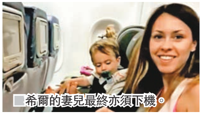
希爾的妻兒最終亦須下機。

美國航空業再爆出趕客落機醜聞，今次主角則輪到達美航空。加州一對夫婦上週與兩名幼子女搭乘達美客機，由夏威夷飛往洛杉磯，但上機後機組人員突然要求他們讓出2歲