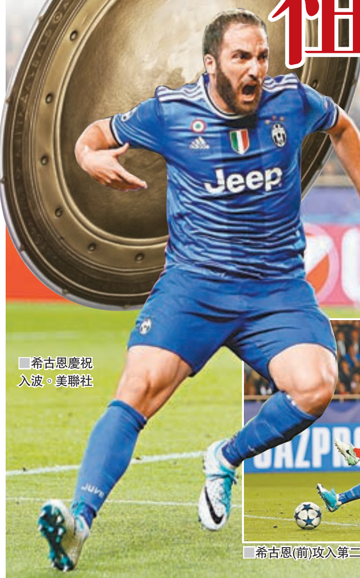
■希古恩慶祝入球。

前摩納哥與祖雲達斯在各自聯賽中領跑。各項賽事轟入146球的摩納哥在歐聯淘汰賽階段接連淘汰曼徹斯特和里昂兩支同樣擅長進攻的球隊，面對今季10場歐聯賽事僅失兩球的祖雲達斯。摩納哥18歲小將基利安洛天開場後用一記頭槌和一記墊射考驗了迎來第100場歐聯比賽的39歲老門將保方。