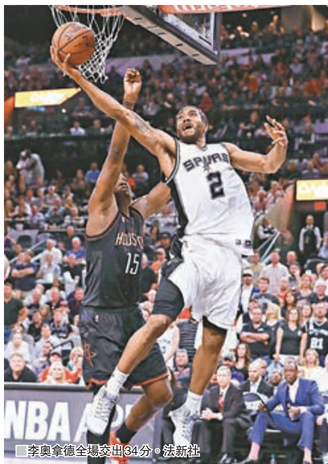
■李奧拿德全場交出34分。

NBA季後賽西岸準決賽首戰在聖安東尼奧被火箭打爆的馬刺，昨日第2戰靠著第4節一波30:5猛烈高潮鎖定勝局，終場121:96還以顏色戰成1:1平手，但老將柏加卻意外傷到左膝蓋提前退場。 前3節馬刺5分鐘領先戰況仍膠着，沒想到決勝節風雲變色，馬刺諸將前8分鐘一輪猛攻狂砍30分，期間火箭只有5分鐘進帳，使得比數一下來到118:88的絕對領先，至此勝敗再無意外。