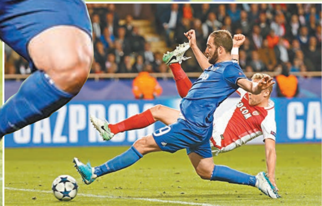
■希古恩(前)攻入第二球。