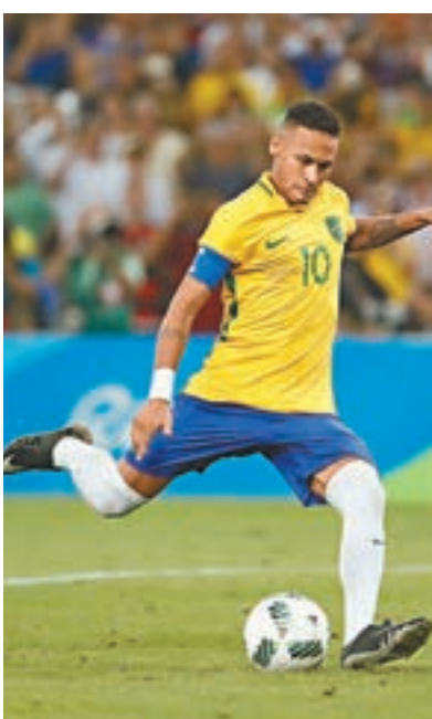
■一項新的互射12碼大戰規則試用。