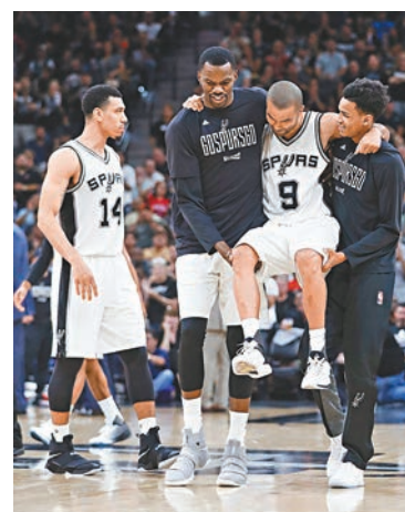
■柏加(右2)由隊友抬出場。