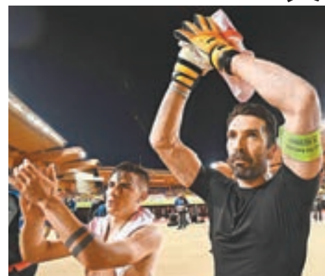
■意大利傳奇門將保方(右)。