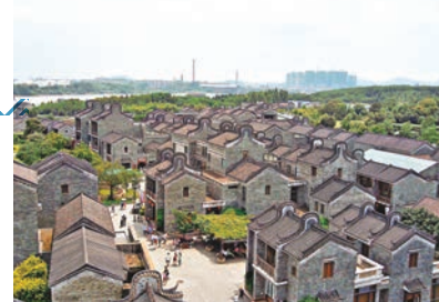
嶺南印象園俯瞰圖。

亮點，更是最能勾起父母童年回憶的活動。據介紹，嶺南印象園新推出的大型原生態技藝表演「印象嶺南」裡囊括了舞獅舞龍、菠蘿雞鳴、賽龍奪錦、祭華光帝、搶包山等傳統嶺南文化項目，從各項表演中讓遊客感受嶺南文化的獨特魅力。除此之外，還原傳統婚嫁儀式的互動式繡球招親、陸豐皮影戲、五華提線木偶戲、嶺南雜耍、嶺南絕技及活人雕塑等，足以讓觀眾沉浸在一派歡樂祥和的節日氛圍中。