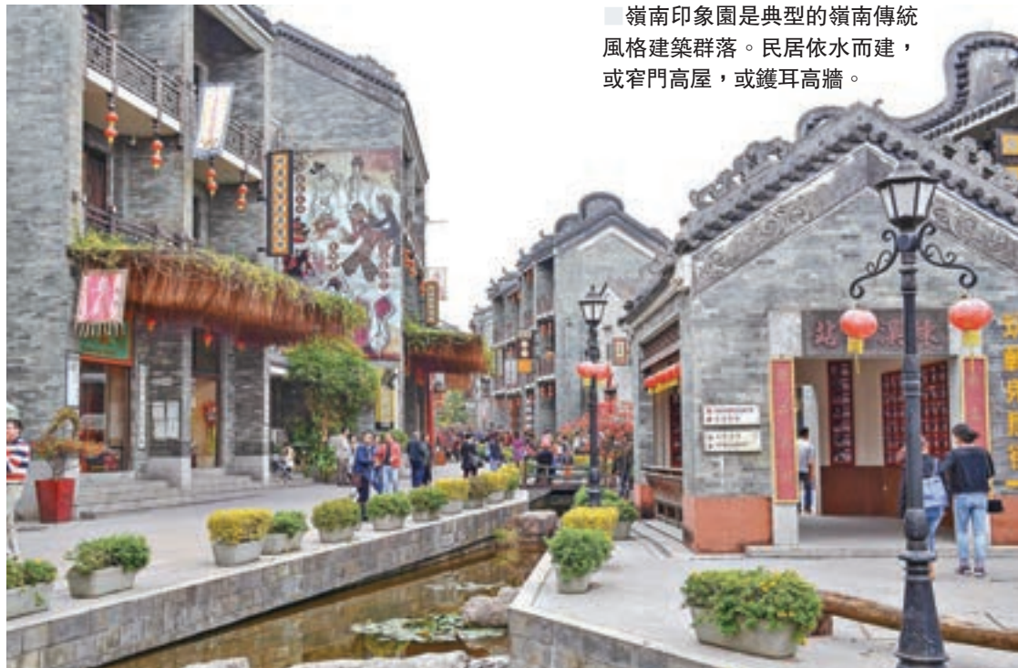
嶺南印象園是典型的嶺南傳統風格建築群落。民居依水而建，或窄門高屋，或鑊耳高牆。