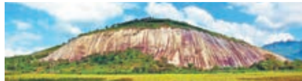
被譽為「天下第一石」的封閉大斑石。

3、美食攻略： 封閉杏花雞、七星土豬肉、蓮都山羊等天然農家美食，以及山水豆腐、新鮮野菜、鄉間野味等美食佳餚，都不容錯過。