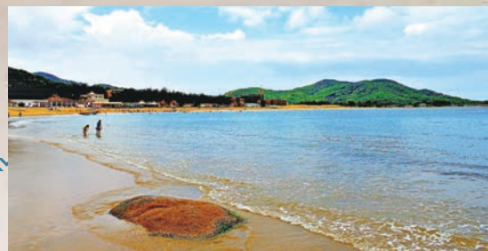
5月天氣漸暖，正是遊客在南澳島戲水的好時光。

如果想看日出，可以去青澳灣。在南澳島眾多海灣美景中，最為著名的就是青澳灣。青澳灣呈半封閉狀環抱海面，海灣似新月，海面如平潮，沙細白，水碧清。由於該灣位於南澳的最東端，因此這裡是廣東省最先看到日出的地方，可謂觀看日出的最佳觀