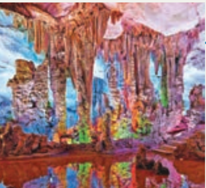
封閉龍山景區的熔岩地貌堪稱奇觀。

封閉龍山風景區素有「廣東小桂林」美譽，佔地面積129.3公頃。龍山風景區最大的特點就是一個「奇」字，它主要包括斑石、千層峰、白石岩、雙龍洞、蓮都十里畫廊以及黑石頂自然保護區等風景名勝，集中了石灰岩、花崗岩和砂岩三種地貌，構成各具特色的巨石、奇峰、幽洞、秀水、林海等自然景觀，成為嶺南「地