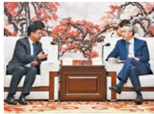
廣州南沙開發區、微軟(中國)有限公司與香江集團在廣州舉行簽約儀式。