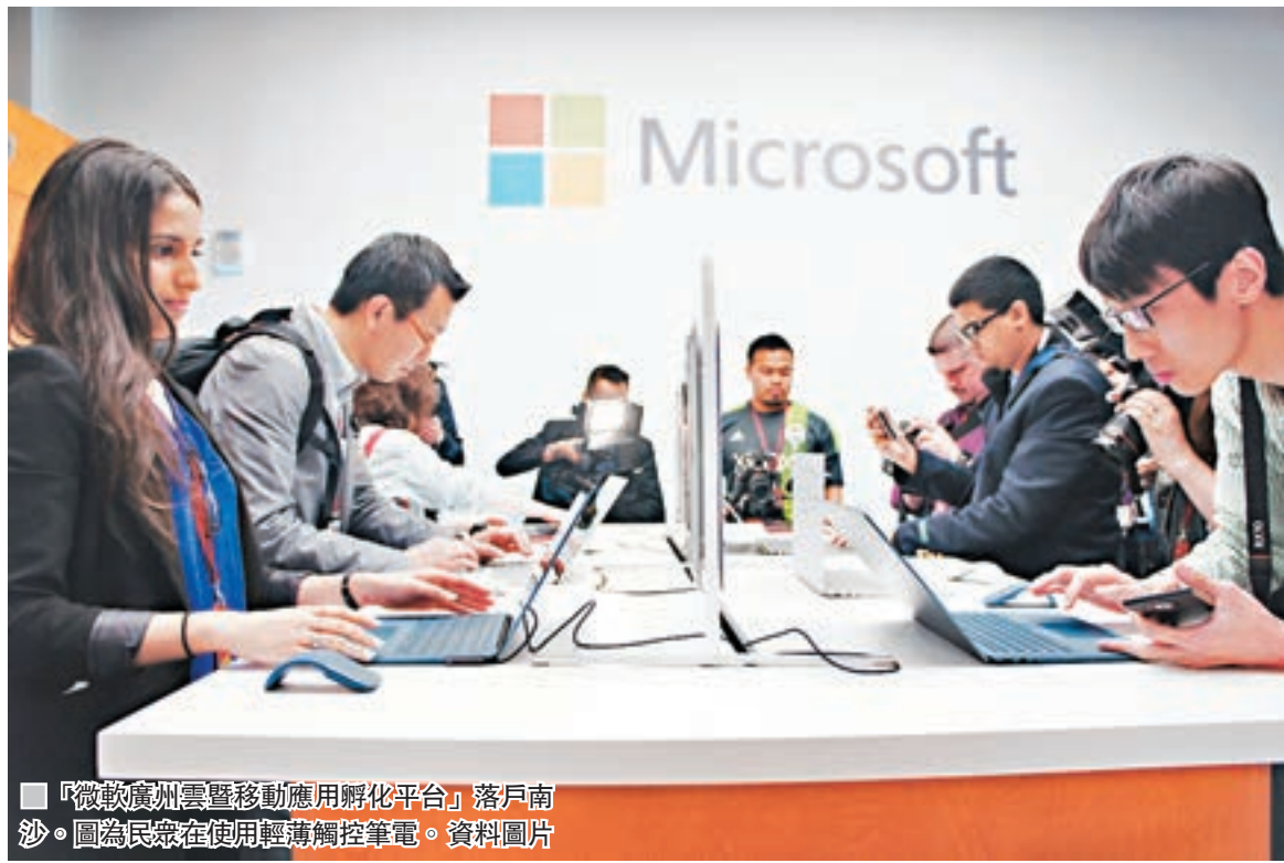
「微軟廣州雲暨移動應用孵化平台」落戶南沙。圖為民眾在使用輕薄觸控筆電。資料圖片

在此過程中,南沙還將合作成立人工智能產業基金,旨在培育一批人工智能領域的獨角獸。在企業扶持上,則配合微軟搭建公共服務平台所需的軟硬件環境、雲資源、智能展廳和專業服務支持,使企業可直接運用微軟平台進行二次開發,在南沙共建一個創新創業的生態圈。