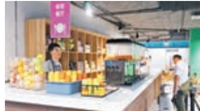
跨境小鎮內設多個大型主題免費體驗區。

南沙區口岸辦相關負責人介紹,目前跨境電商B2C(商對客)進出口監管中心已完工,並上線運行,實現了