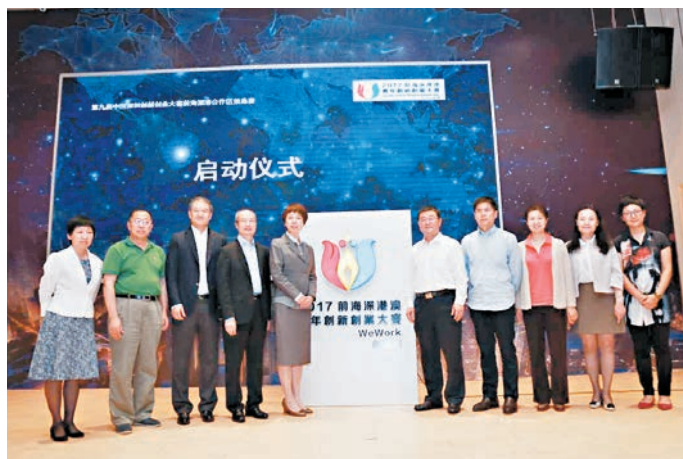
2017前海深港青年創新創業大賽昨日舉行啟動儀式。

據了解,主辦方為此次大賽配套一系列優惠政策,包括獲獎項目將優先獲得大賽合作創投機構的天使投資,並優先入駐前海深港青年夢工場,享受免租期一年,香港青年協會賽馬會社會創新中心將為優勝隊伍提供免租共享空間一年等。