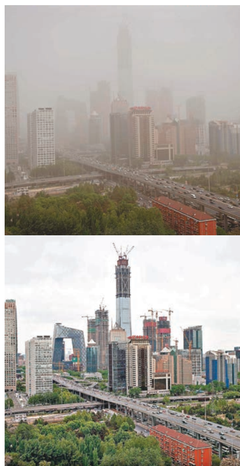
北京市區黃沙漫天。圖為北京CBD，上圖攝於昨日，下圖攝於4月25日。

據了解，本次沙塵天氣是受上游沙塵暴和近期降雨量小等因素影響而形成。北京市教委相關負責人表示，市教委已發佈通知，提醒全市幼兒園、中小學校引導學生注意防範，減少戶外活動，做好健康防護措施。