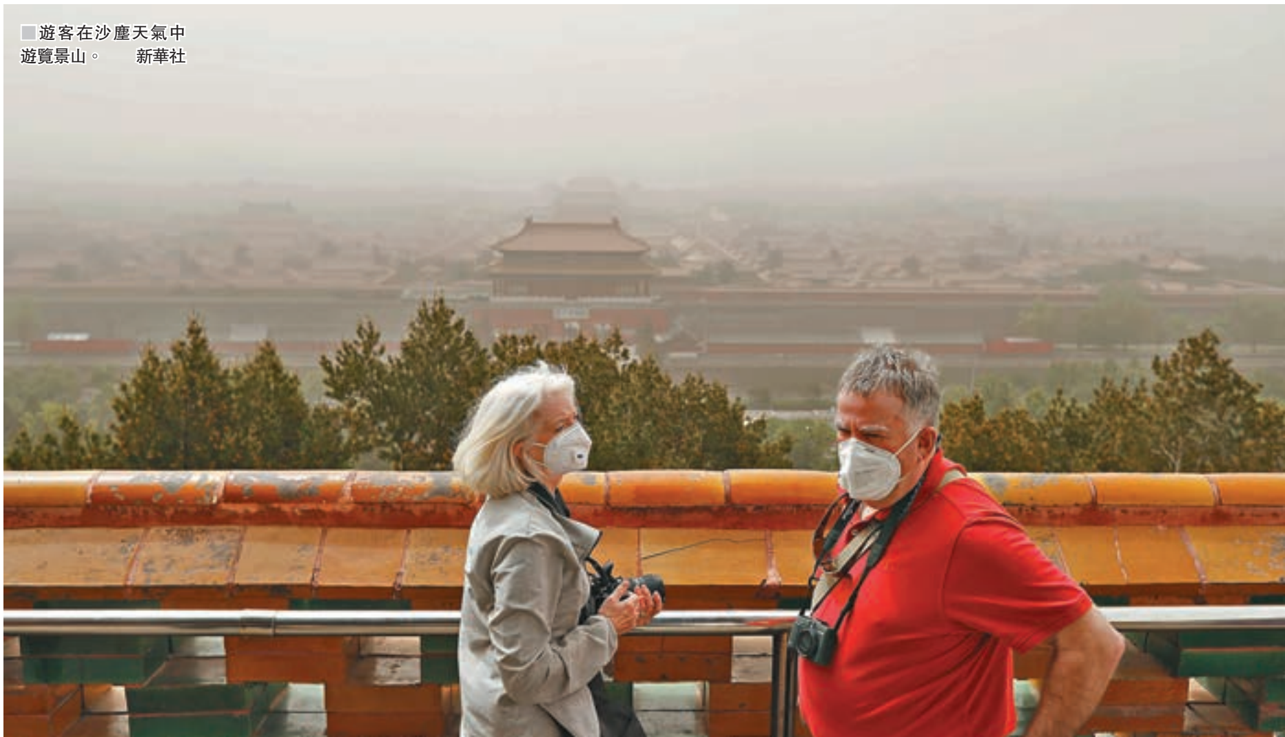
遊客在沙塵天氣中遊覽景山。

環境氣象專家介紹，今年北方地區已出現7次沙塵天氣過程，雖少於近十年同期平均次數（8.4次），但此次沙塵過程影響範圍和強度，均創下今年以來之最。而造成的如此大範圍沙塵天氣的原因則是由於近期北方地區降水少、氣溫高，以及風速大、沙塵輸送強等。中央氣象台預計，受冷空氣和氣旋共同影響，未來三天北方地區仍有大風沙塵天氣，其中北京地區受冷空氣影響，今日或有5-6級偏北風，陣風可達8-9級，局地仍可能伴有揚沙。