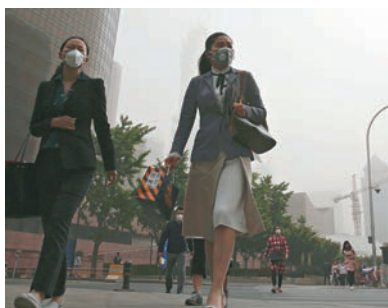
北京民眾戴口罩出行。

學，開車經過奧林匹克公園，遠遠看去，感覺鳥巢和水立方埋沒在漫天黃沙當中，給人一種若隱若現的感覺。王女士吐槽稱，空氣污染這麼嚴重，學校居然不停課，還讓孩子在這「鬼天氣」裡上學，「車開出去半個小時，擋風玻璃上都一層灰，真是不理解。」