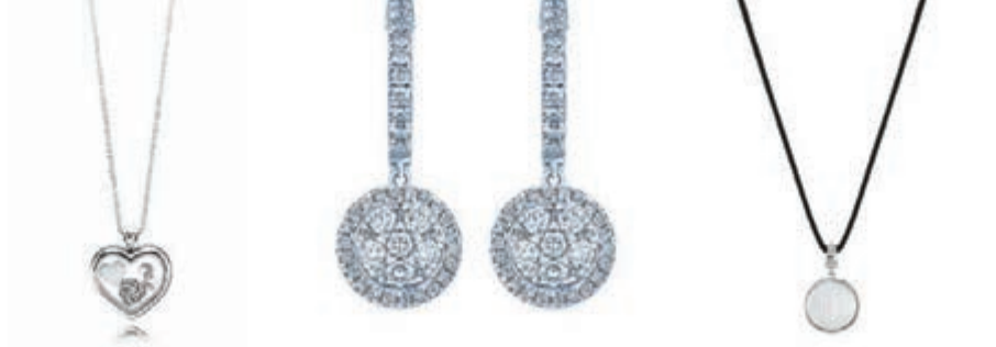
PANDORA 心形吊墜盒 TSL Nova 繁星系列 LALIQUE 魅力系列

至於TSL謝瑞麟則呈獻「Nova 繁星」系列、「心·柔」系列及「珠光瑰寶」系列,讓閃亮鑽飾帶出溫馨的親情故事。Nova 繁星系列中的精巧圓狀鑽飾,設計成外圍的小鑽石圍繞着中央主石,猶如媽媽的愛把子女包圍着,代表媽媽的愛意。內外兼顧的賢淑媽媽,牽着小手,勇往直前,即使媽媽重投工作崗位,內心始終時常惦记孩子。孩子快樂的成長,是媽媽閃亮人生的原動力。