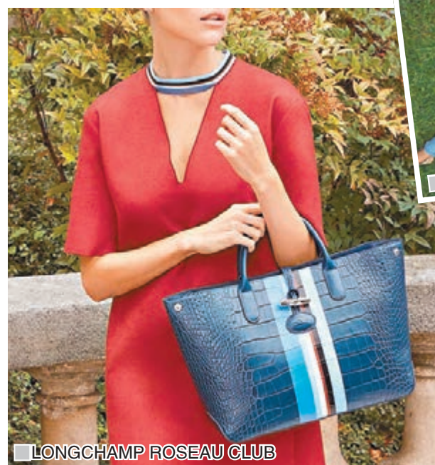
LONGCHAMP ROSEAU CLUB