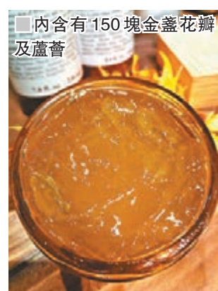
內含有150塊金盞花瓣及蘆薈

這款全新面膜,特別為所有肌膚類型而設,敏感肌膚亦可適用,只要輕塗全面,短短5分鐘後,肌膚瞬即感覺保濕、舒緩、清新,可算是簡易速效的修護步驟。面膜性質溫和,可定期每周使用3次,或於長途飛行後、繁忙壓力工作天或睡眠不足等情況下為肌膚急救。它