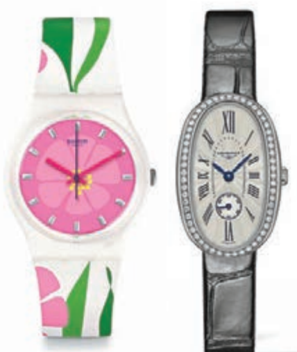
Swatch PRIMEVERE LONGINES

母親的雙手,有一種溫暖、幸福的安全感,她用這雙手為我們遮風擋雨,將我們撫育成人。藉着今年母親節,讓身為子女的我們以一枚優雅腕錶,為這雙手送上一份敬意。瑞士著名鐘錶品牌LONGINES 推介一款 Symphonette 圓舞曲系列腕錶,其橢圓形錶殼展現出女士們的溫柔與嫵媚,精鋼與鑽石搭配的錶殼散發璀璨光芒,令追求與別不同的她為之動容。