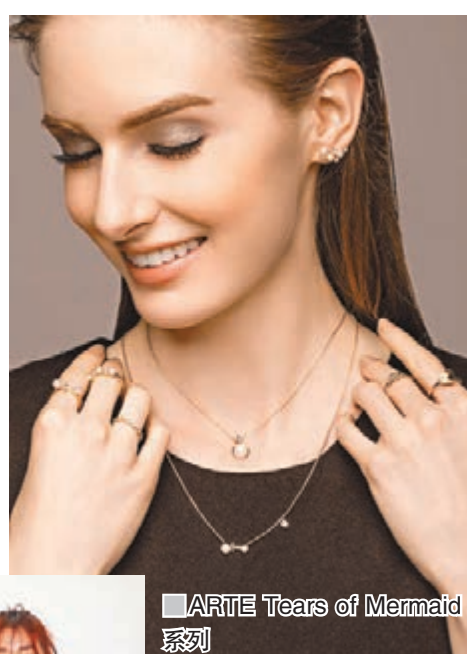
ARTE Tears of Mermaid 系列