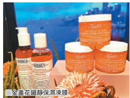
金盞花鎮靜保濕凍膜

自1851年起,源自美國紐約曼克頓護膚用品界翹楚Kiehl's Since 1851,從世界各地搜尋最優質、最有效的天然成分製成護膚品。品牌於1960年代,推出金盞花植物精華爽膚水,以人手採摘的金盞花瓣,結合精心研製的配方。時至今日,品牌產品研發專家繼續利用金盞花的溫和性質和舒緩功效,特別研製金盞花蘆薈鎮靜保濕凍膜,啫喱配方內蘊含150塊金盞花瓣及蘆薈,只需輕塗面上,立即發揮清新保濕功能,肌膚感覺清爽涼快。