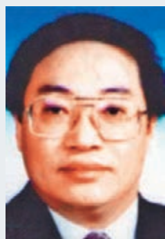
「紅通」逃犯王黎明。