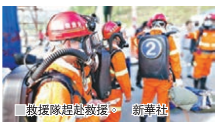
救援隊趕赴救援。

香港文匯報訊 據中新社報道，記者從大方縣委宣傳部獲悉，昨日14時50分許，在建的成都至貴陽快速鐵路貴州大方縣境內六龍鎮營盤村七扇岩隧道發生疑似瓦斯爆炸，12人被困，12人受傷。