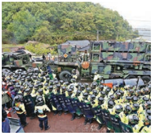
在部署薩德的過程中，韓國警方與當地民眾及和平人士發生衝突。