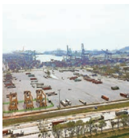
廉差邦港是泰國最大的集裝箱港口和物流樞紐。中新社

按照計劃，為適應今後8年至10年的集裝箱運輸量的增長，未來廉差邦港貨櫃吞吐量將從每年700萬標準箱提高到1,800萬標準箱。佐羅茲表示，泰國當地政府將在廉差邦港口優先規劃發展物流產業，特別是加快鐵路和公路網的建設。相信隨着「一帶一路」建設的推進及「泰國4.0」戰略的實施，廉差邦港將愈發閃現出耀眼光芒，成為區域海運樞紐上的「明珠」，成為中國—東盟自貿區通往世界各地的重要門戶。 ■中新社