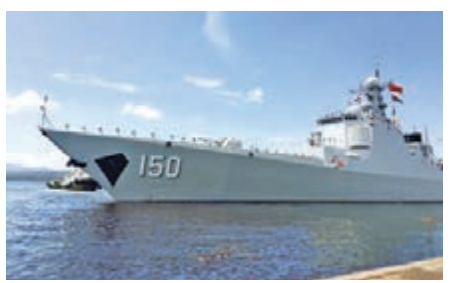
菲律賓總統杜特特日前參觀了「長春艦」。

香港文匯報訊 據中新報社，中國外交部發言人耿爽昨日表示，菲律賓總統杜特特登臨訪菲律賓達沃市的中國海軍軍艦，體現了中菲日益提升的政治互信。中方願同菲方一道，繼續增進互信，妥善處理南海問題，推動中菲關係持續健康穩定發展。