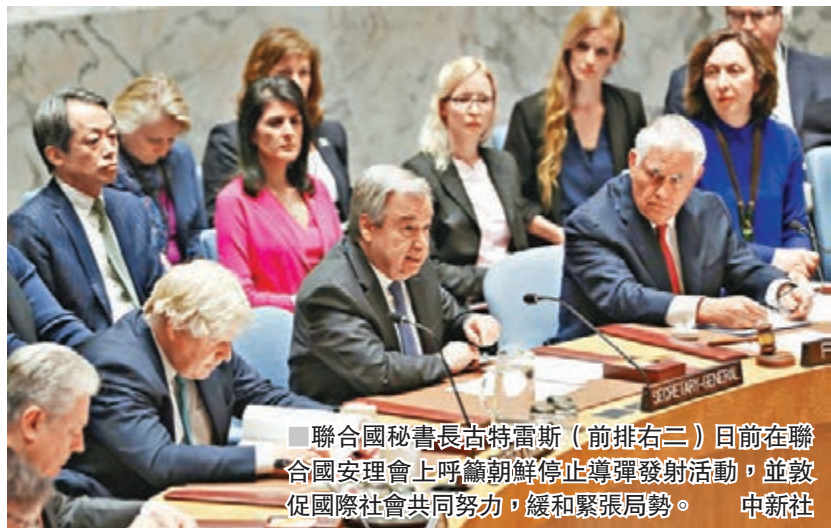
聯合國秘書長古特雷斯(前排右三)日前在聯合國安理會上呼籲朝鮮停止導彈發射活動，並敦促國際社會共同努力，緩和緊張局勢。

傅瑩表示，目前朝核問題或出現三種可能性。第一種可能性是維持現狀，放任對朝制裁升級和朝鮮核導試驗相互刺激的情況反復出現，直到朝鮮核導技術達到「臨界點」。而由於朝鮮擁核自衛的決心十分堅定，經濟的相對封閉又不能使得制裁徹底發揮效用，核導技術一旦達到「臨界點」，反對北韓擁核的人反而將面臨艱難選擇。第二種可能性是朝鮮政權垮台，此種結果最為美韓樂見。但隨着朝鮮經濟狀況已經出現改善，以「政權崩潰」作為解決朝核問題的方案，在短期內實施並不現實。第三種可能性是美朝恢復對話和認真談判，這有利於穩定朝核態勢，為解決雙方關切問題創造條件，更是達成協議的必由之路。