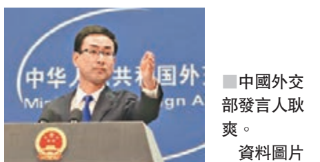
中國外交部發言人耿爽。資料圖片

香港文匯報訊 據新華社報道，外交部發言人耿爽昨日表示，按工作計劃，今年上半年中國和東盟國家將完成「南海行為準則」框架草案的磋商。