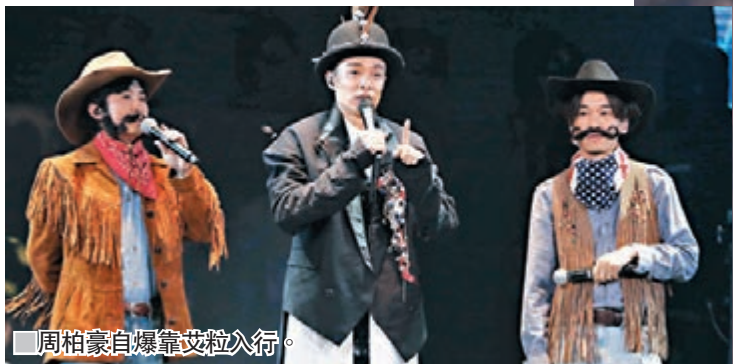
周柏豪自爆靠艾粒入行。

香港文匯報訊(記者 李思穎)一連三場周柏豪《One Step Closer Pakho Live 2017》演唱會昨晚假紅館完滿結束，柏豪的太太繼續低調未見現身，而請來的其中一位嘉賓蔡卓妍(阿Sa)則被柏豪踢爆是「小富婆」，柏豪更抵死地說：「由細聽阿Sa的歌曲大。」激得阿Sa紮紮跳，忍不住回敬叫柏豪去死，令全場大笑。人夫柏豪見到台下有位大肚歌迷時，有送上祝福，自言和太太都很喜歡小朋友，亦有「造人」計劃，但暫時先享受二人世界。