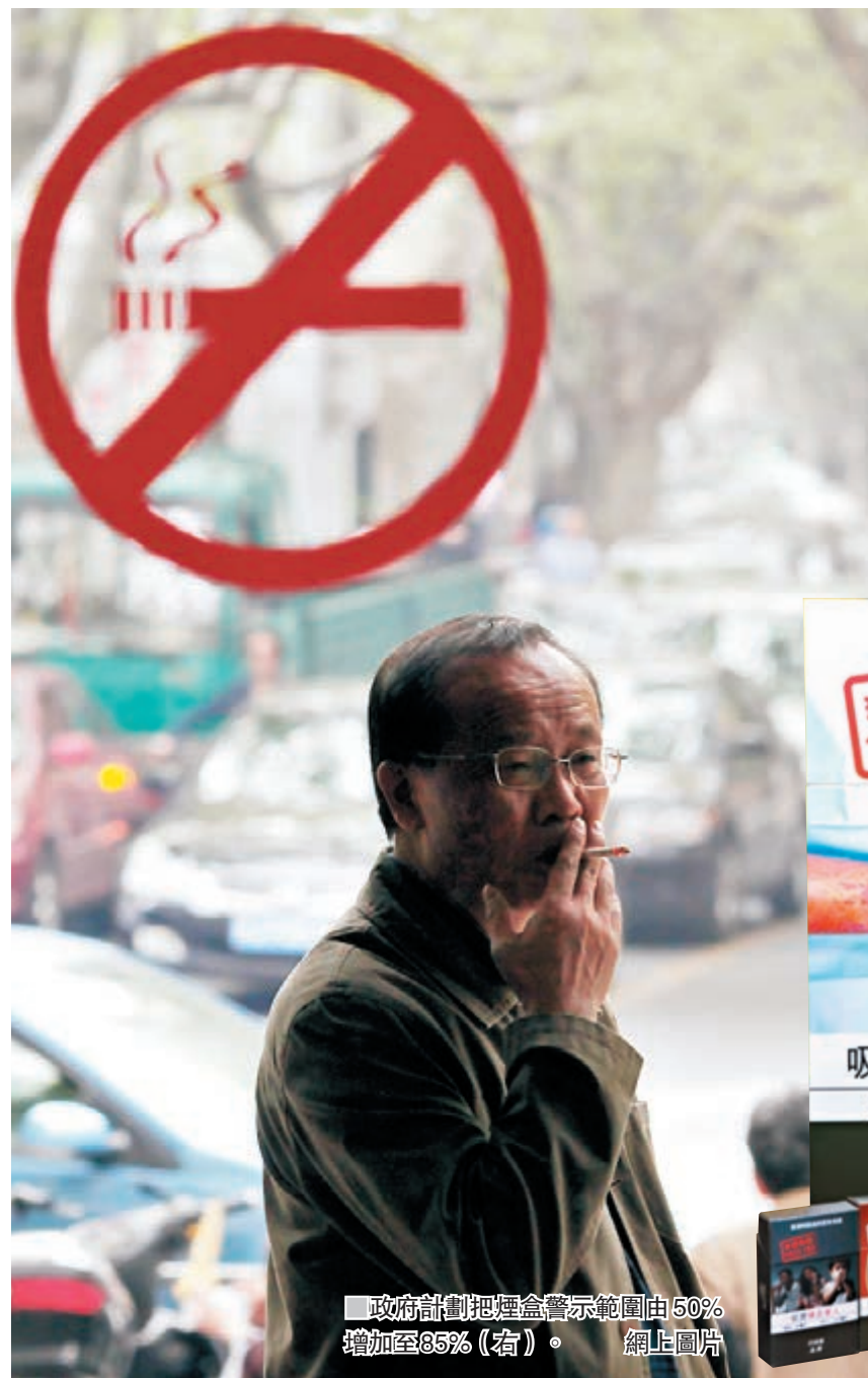
政府計劃把煙盒警示範圍由50%增加至85%(右)。網上圖片