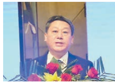
山東省臨沂市市長張術平。