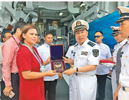
中國海軍艦艇編隊指揮員沈浩少將向登艦參觀的達沃市長薩拉·杜特爾特女士贈送紀念品。

據東棉蘭老軍區28日發佈通告稱，中國導彈驅逐艦長春艦、導彈護衛艦荊州艦以及綜合補給艦巢湖艦將由東海艦隊副司