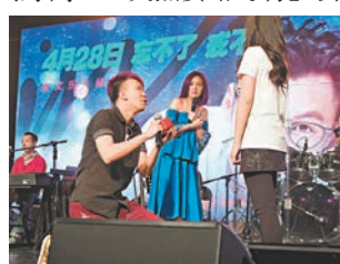
同場千嬅見證男粉絲求婚成功。

係咪整蠱節目?你哋夾埋整蠱我?」千嬅邊笑邊解釋:「好似好尷尬,明明大家太開心……(你想大家點幫你投入返個情緒呢?)頭先講到好開心,突然要咁『行』去嗰交,我要冷靜吓先!(大家都幫緊你!)你唔好叫全場一齊嗰開我呀!」結果順利完成合唱。