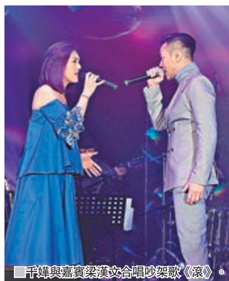
千嬅與嘉賓梁漢文合唱吵架歌《滾》。