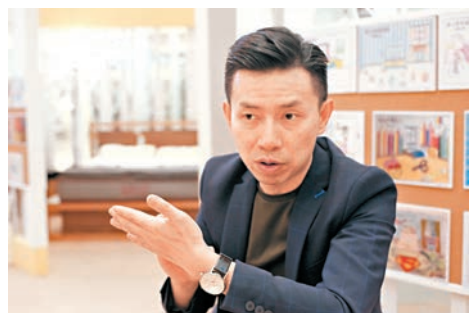
湯兆榮指，燈光顏色會影響整個空間的色調。