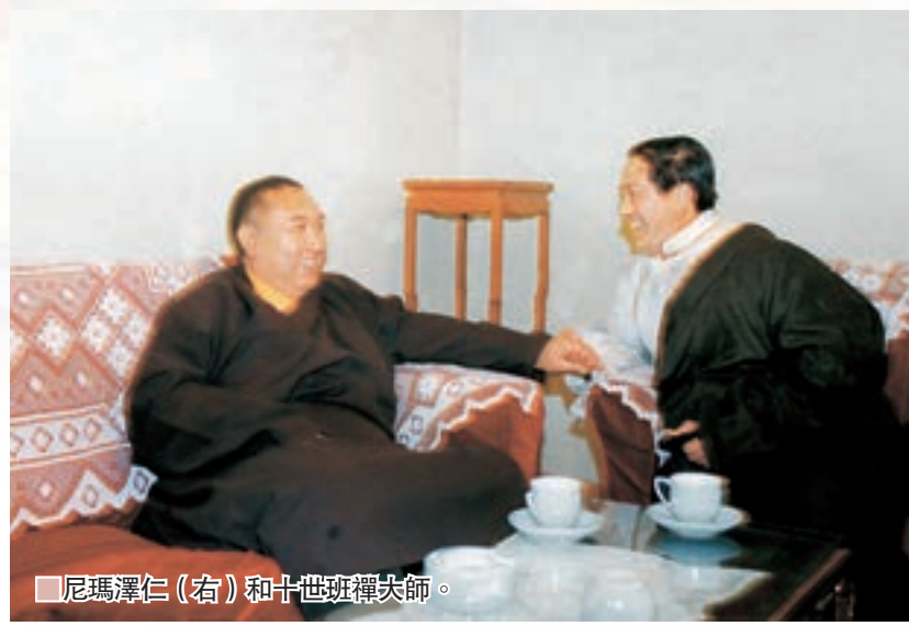
尼瑪澤仁(右)和十世班禪大師。

赴世界20餘個國家和地區的博物館、美術館舉辦個人大型畫展和聯展。業界人士分析指，他的作品體現了藏、漢族文化和西方民族藝術相融合的整體風格，充滿了想像力，莊嚴肅穆，深刻描繪出藏族對世界的感知。