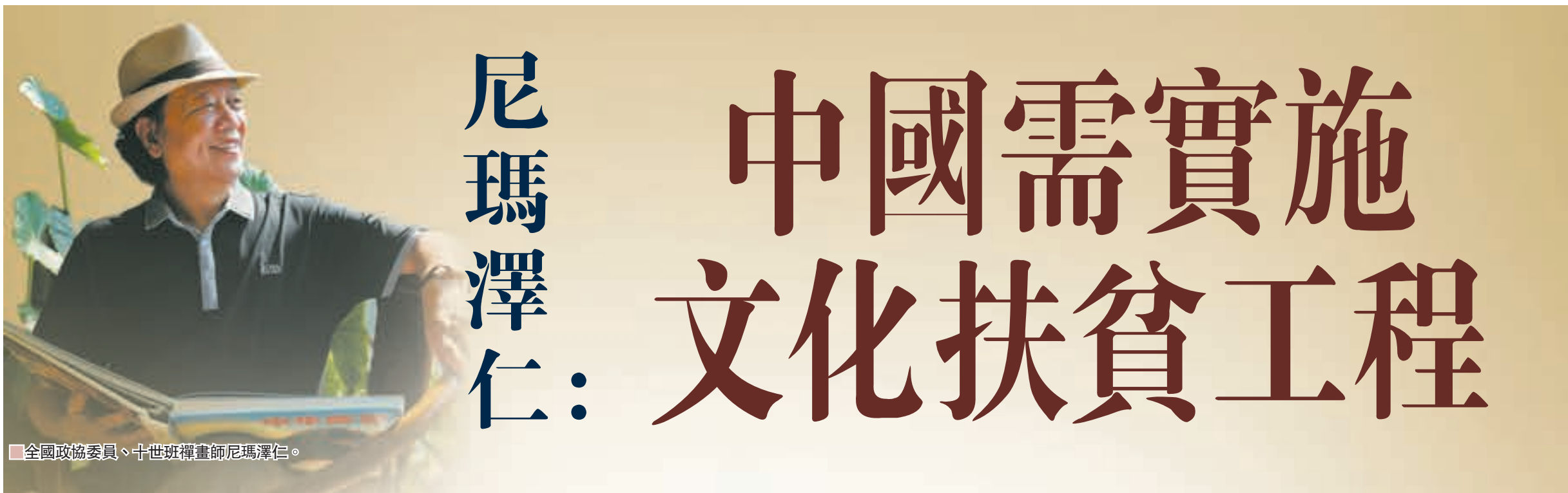
全國政協委員、十世班禪畫師尼瑪澤仁。