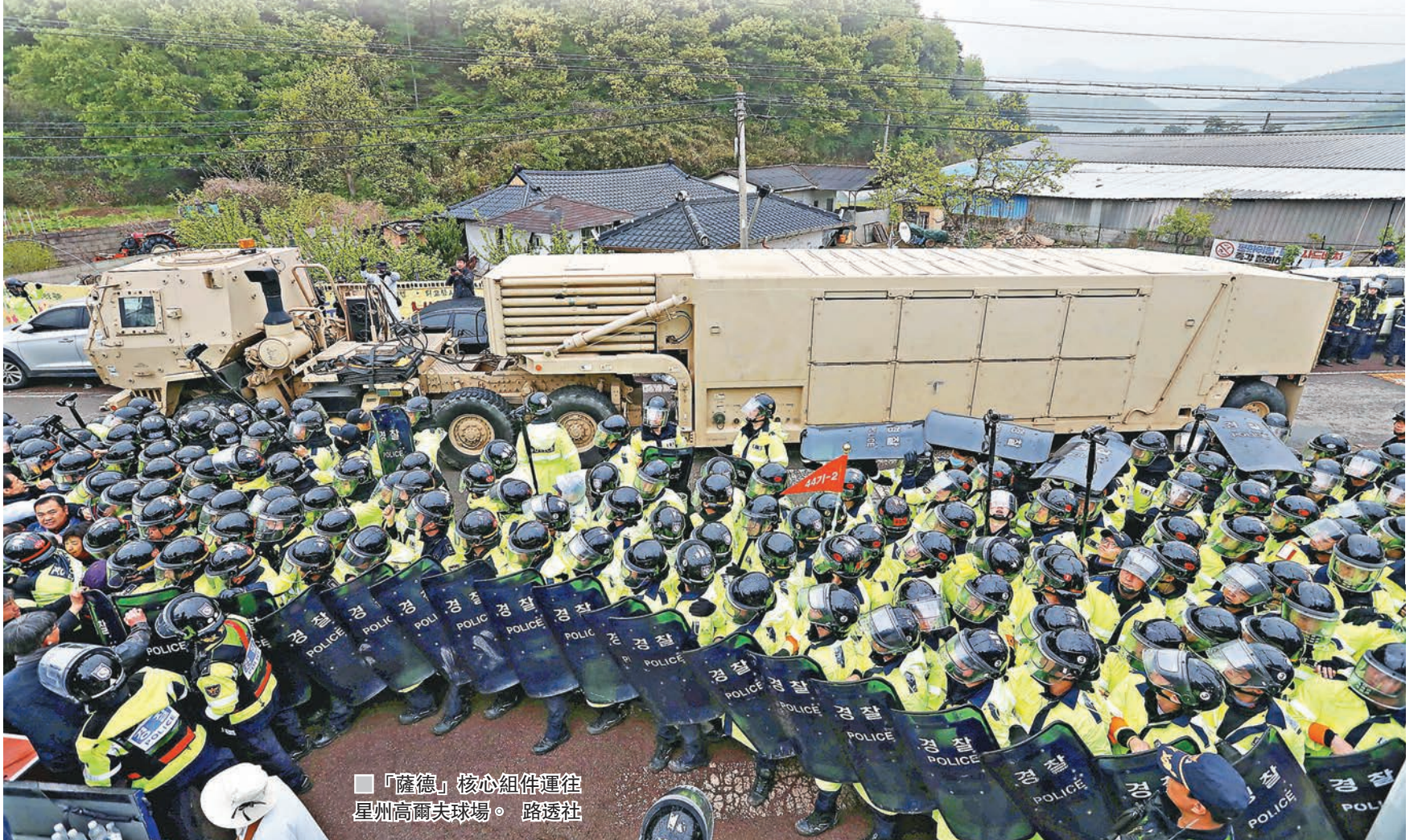
■「薩德」核心組件運往星州高爾夫球場。