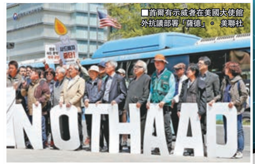
■首爾有示威者在美國大使館外抗議部署「薩德」。