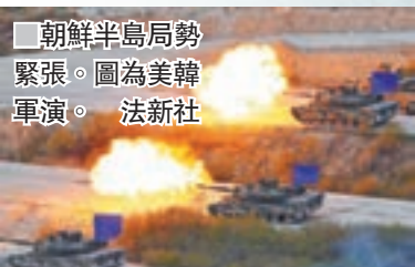
■朝鮮半島局勢緊張。圖為美韓軍演。