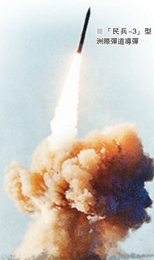
■「民兵-3」型洲際彈道導彈