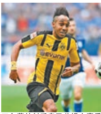
■多蒙特射手奧巴美揚本賽季德甲至今狂入27球。