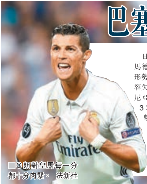
■朗對皇馬每一分都十分肉緊。

日前西班牙打吡美斯補時絕殺皇家馬德里，令今季西甲足球聯賽的爭標形勢白熱化。餘下6場聯賽變成最多只容失2分的皇馬，明晨西甲作客拉科魯尼亞料必空群出擊（now632台周四3:30a.m.直播），畢竟巴塞主場撲擊榜尾球隊奧沙辛拿全取3分在望（now632台周四1:30a.m.直播），皇馬此戰若敗便很可能將爭標主動權拱手讓人。