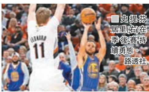
■史提芬居里(右)在季後賽持續真誠。

金州勇士昨天以128:103擊敗波特蘭拓荒者，在NBA季後賽首輪4戰全勝橫掃對手，晉級西岸四強。在當家球星史提芬居里全場交出37分、8次助攻及7次籃板的帶領下，勇士於7戰4勝系列賽4戰全勝橫掃拓荒者。