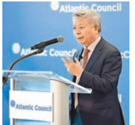
「亞投行」行長金立群表示，「亞投行」歡迎美國私營部門參與項目競標。