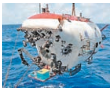
「蛟龍號」載人潛水器已抵達南海作業區，準備潛海。