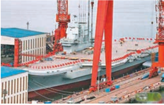
國產航母甲板上被插遍紅旗。