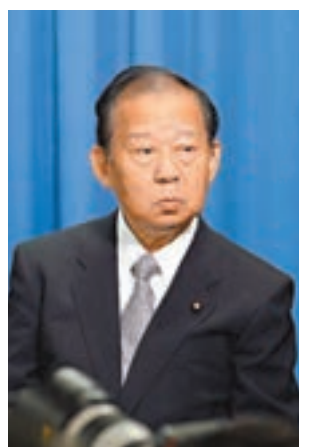
日本自民黨幹事長二階俊博將出席「一帶一路」峰會。