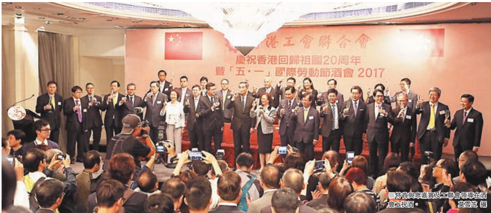
特首與眾嘉賓及工聯會領導在酒會上祝酒。

香港文匯報訊（記者 鄭治祖）工聯會昨晚舉行五一國際勞動節酒會。候任特首林鄭月娥特別前來感謝工聯會在競選期間的支持，並承諾未來5年將會團結社會、改善行政立法關係，創造更和諧的香港社會。工聯會理事長吳秋北則表示，香港經濟有增長，失業率長期維持低水平，但普遍面臨着就業質量下降、分配不公、保護勞工政策及立法滯後等問題，未能有效保護勞工合理權益。他強調，工聯會作為全港大多數打工仔的代表，必會與打工仔迎難而上，會以有理、有利、有節方式，在勞資官三方平台上爭取各項保障勞工權益的立法，如取消強積金對沖、爭取標準工時等。