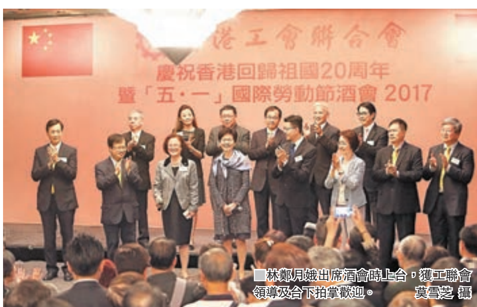
林鄭月娥出席酒會時上台，獲工聯會領導及台下拍掌歡迎。

今年適逢香港回歸祖國20周年，吳秋北表示，儘管香港在過去20年經歷不少風浪及挑戰，但在國家的大力支持下，在中央政府對「一國兩制」的堅持及維護下，在特區政府和市民的努力下，「一國兩制」才得以有效實踐。他強調，只有準確、完整地理解、執行香港基本法，在香港自身發展同時充分顧及國家領土完整、安全及發展利益，香港才能繁榮穩定，市民生活