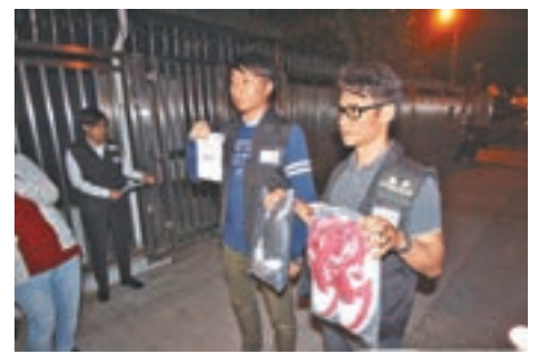
警方展示在燒車案疑犯家中檢取的證物。