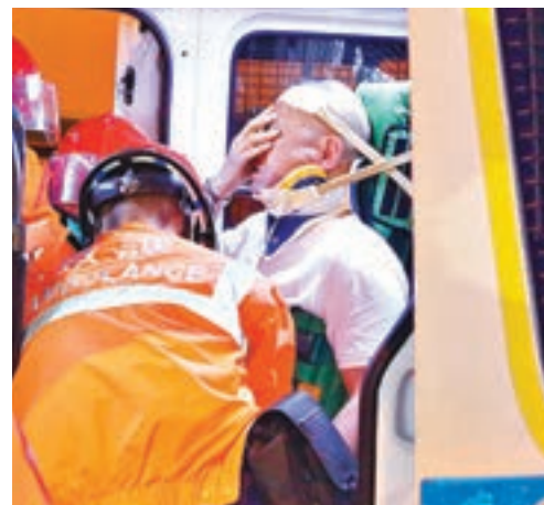
Audi司機事後亦報稱受傷送院。