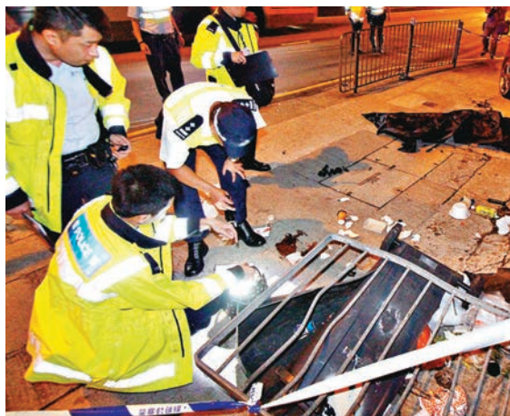
警員檢視被撞毀飛脫的鐵欄。