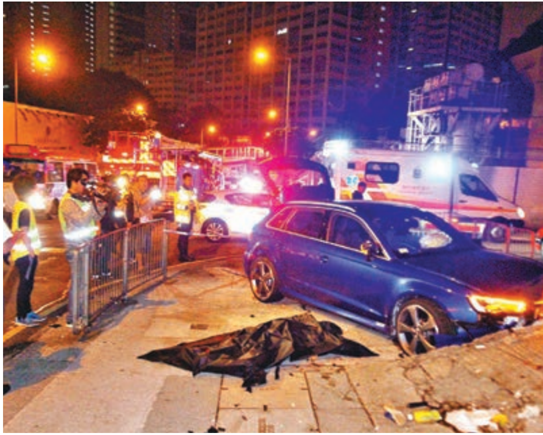
肇禍撞死女途人的Audi房車，屍體被遮蓋。

早上9時許，警員重返現場蒐證，包括進入附近一間輪胎舖翻查閉路電視紀錄，逗留約1小時離開。由於意外現場有一巴士站，不少乘客在該巴士站候車，但巴士站沒有避車位置，乘客均表示日後等車會「企後少少」以策安全。警方呼籲任何人如目睹意外發生或有任何資料提供，請致電3661 1446與調查人員聯絡。