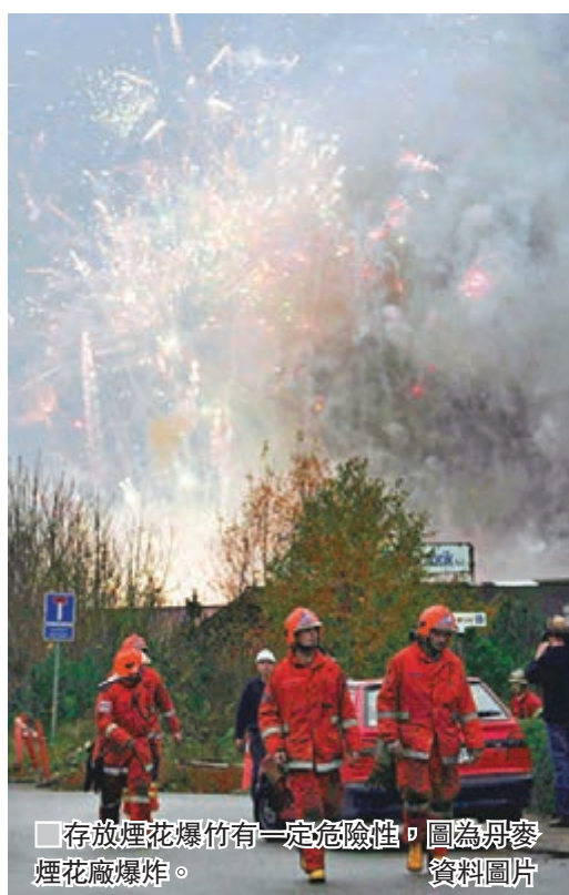
■ 存放煙花爆竹有一定危險性。圖為丹麥煙花廠爆炸。