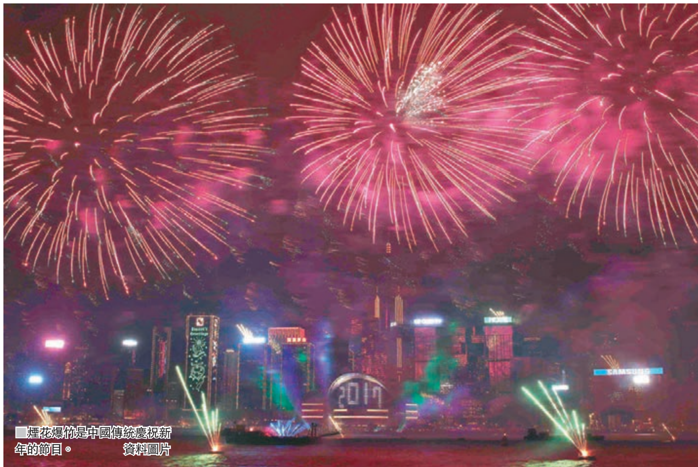
■ 煙花爆竹是中國傳統慶祝新年的節目。 資料圖片

PM2.5是指直徑小於或等於2.5微米的微細懸浮粒子，是衡量空氣污染的主要指標之一。人體吸入微細懸浮粒子會對呼吸系統和心血管系統造成負面傷害，長遠而言對社會的經濟及醫療系統造成負擔。現時環保署每小時在三個地點更新PM2.5濃度數據，以了解香港的空氣質素水平。