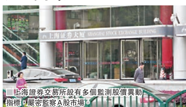
上海證券交易所設有多個監測股價異動指標，嚴密監察A股市場。

事實上，不少內地小散的確還苦心甘鑽研「莊家抬轎經典指標」、「莊家抬轎選股公式」等，旨在識破主力意圖，從不同時點切入，把握盈利良機。可見在A股這個龐大的