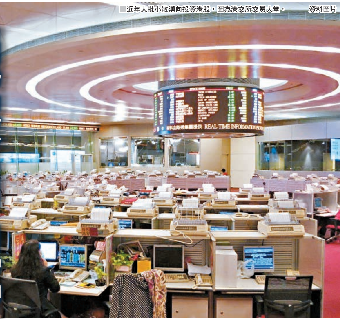
近年大批小散湧向投資港股，圖為港交所交易大堂。