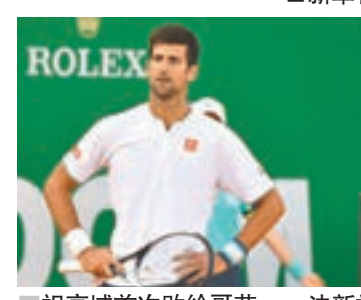
祖高域首次敗給哥芬。

西班牙「紅土之王」拿度昨日ATP蒙地卡羅大師賽8強以6:4、6:4淘汰八強唯一非種子球手舒華斯文，延續爭奪第十座賽事冠軍的夢想。拿度準決賽對手並非賽前預測的塞爾維亞名將祖高域，二號種子當日經三盤苦戰輸1:2被10號種子哥芬淘汰。 ■新華社