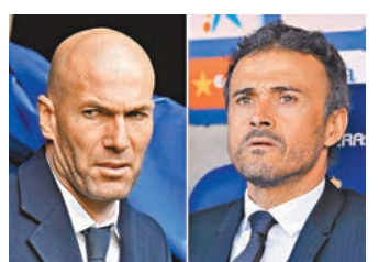
安歷基(右)和施丹，今季西甲的最後爭霸。資料圖片

皇馬與巴塞近年不乏爭標關鍵戰。2015年3月22日(歐洲時間，下同)巴塞主場贏皇馬2:1，C朗入球後馬菲奧扳平，蘇亞雷斯下半場奠勝，確立4分優勢進入季尾，最終順利封王。2012年4月21日，以4分領頭的皇馬藉C朗立功作客贏巴塞2:1，最終白衫軍亦在該賽季笑到最後。因此，今場西甲打吡的3分對冠軍形勢尤為關鍵。