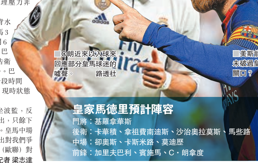
朗拿度近來以入球來回應部分皇馬球迷的嘔聲。