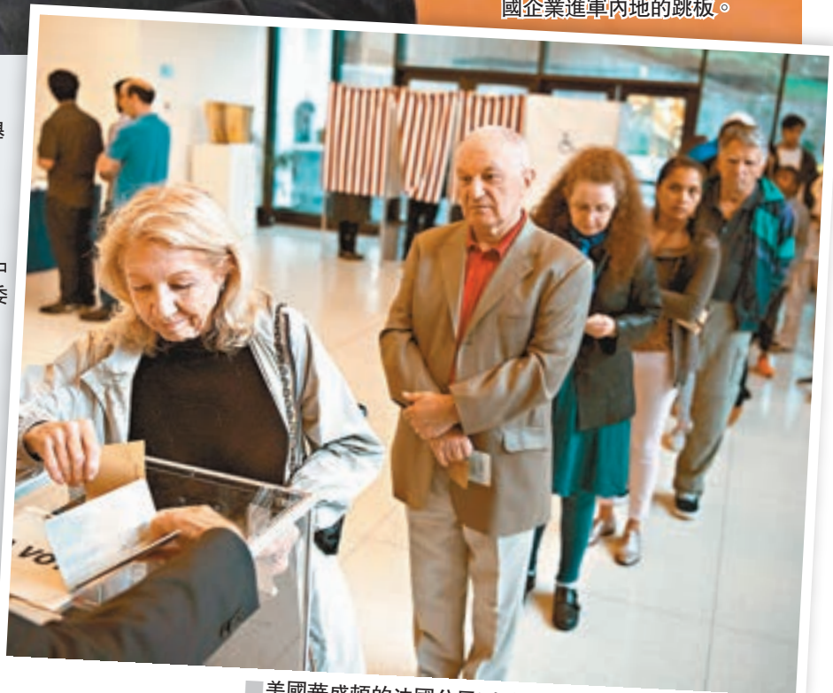
美國華盛頓的法國公民到駐美法國大使館投票。