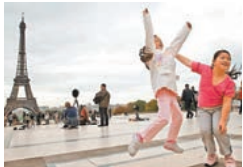
2015年訪法的華客有220萬人次，去年稍跌至180萬，後來逐漸回升。

牌，亦在旅遊區增設免費WiFi，全力支持。在今年藝術節，香港文化博物館將與羅浮宮合辦專題展覽，展出羅浮宮的藏品。