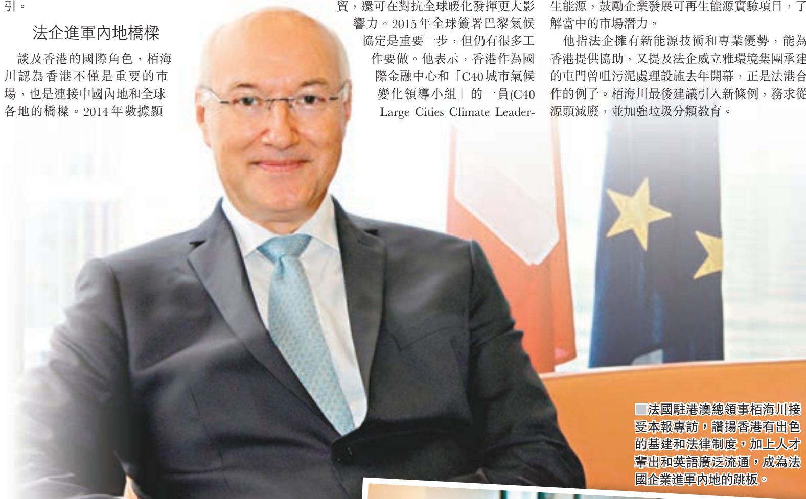
法國駐港總領事栢海川接受本報專訪，讚揚香港有出色的基建和法律制度，加上人才輩出和英語廣泛流通，成為法國企業進軍內地的跳板。

談及香港的國際角色，栢海川認為香港不僅是重要的市場，也是連接中國內地和全球各地的橋樑。2014年數據顯示，