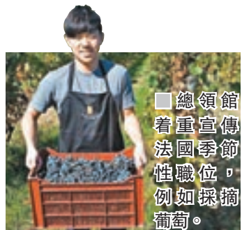
總領館着重宣傳法國季節性職位，例如採摘葡萄。

在教育交流方面，每年超過600名香港學生赴法留學，而選讀短於3個月課程的學生毋須申請學生簽證，不經總領館審批，因此實際人數或高於此。此外，與香港的大學達成合作關係的法