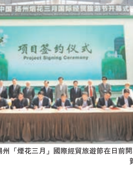
2017中國·揚州「煙花三月」國際經貿旅遊節在日前開幕。圖為項目集中簽約。

香港文匯報訊（記者賀鵬飛 揚州報導）2017中國·揚州「煙花三月」國際經貿旅遊節在日前開幕，吸引海內外上千家客商參加。現場共有36個國內外項目集中簽約，總投資折合約526億元（人民幣，下同）。 華僑城簽150億旅遊項目 現場簽約項目中，投資額最大的是華僑城投資的大型文化旅遊綜合項目，總投資多達150億元，其次為總投資60億元的啟迪科技園項目和總投資50億元的蘇州中來光伏新材股份有限公司的太陽能電池組件項目。 外資項目中，投資額最大的則是總投資3億美元的台灣東貝有限公司LED封裝照明項目。有8個港資項目在現場簽約，包括總投資1.5億美元的蘇美達光伏配電元器件項目和總投資1.3億美元的香港保來得集團工業增資項目等。 包括現場簽約項目在內，本次經貿旅遊節期間共有175個項目分批簽約。其中，在揚州市邗江區舉行的產業發展推介大會暨項目簽約儀式上，就有32個項目現場簽約，總投資折合人民幣148.4億元，其中包括利星行產業綜合體等多個港商投資項目。