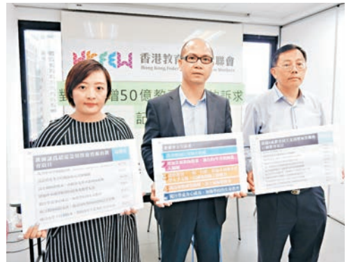
■教聯會昨公佈調查結果。

違規辦學的「香港民間學院」無限上綱，無視教育局日常工作，聲言對其作警告是「打壓」，但實情是，局方平均每日接獲多於1宗（每年約380宗）有關懷疑未經註冊辦學的同類投訴，均會按程序作巡查、搜證，並作出適當跟進。