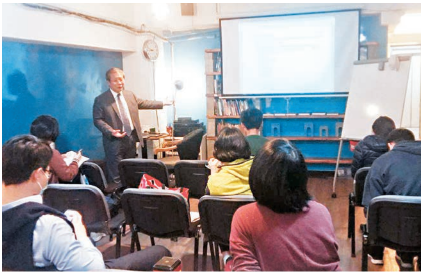
■從「香港民間學院」的fb圖片可見，學院的課程以授課形式進行，與所謂「興趣班」相去甚遠。

香港文匯報訊（記者 姬文風）由所謂「本土」組織開辦的「香港民間學院」，一直模仿專上學院形式，無牌經營各類收費學術課程，至今吸引了數百名學生報讀。教育局接獲投訴並經巡查，近日以涉嫌違反《教育條例》向負責人發出書面警告。該校負責人撰文反咬遭局方「政治打壓」，又迴避其課程近似專上教育的內容，聲稱教育局人員曾提及「只要不涉及『中小學課程』，『興趣班』就唔需要申請辦學牌」。不過，文中同時「自爆」，暗示其不作學校註冊其實是「錢作怪」，是因為未能應付所涉及的數十萬元開支。