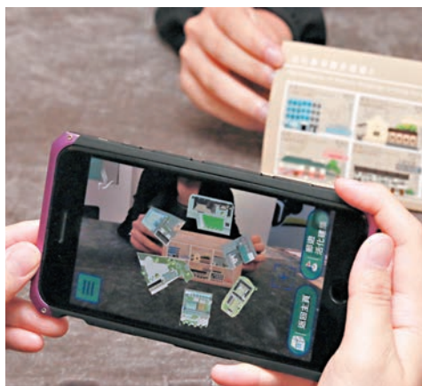
■今次6款特別郵票首次加入AR擴增實境技術。彭子文 攝

香港文匯報訊（記者 陳文華）香港郵政昨日推出第二期「活化香港歷史建築」特別郵票，以6個活化歷史建築項目為藍本，設計6枚特別郵票，包括We 嘩藍屋（$1.7）、油街實現（$2.2）、綠匯學苑（$2.9）、石屋家園（$3.1）、元創方（$3.7）及茂蔭街活化項目（$5）。