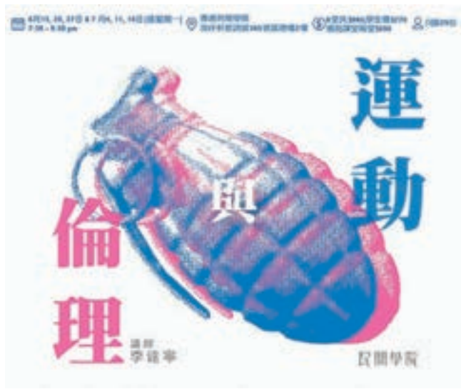
■「香港民間學院」的課程收生達25人，涉嫌違反《教育條例》。

對派中人其身不正、肆意違法違規，在有關當局既按法例及程序跟進時，就大呼「打壓」，已成為他們的例牌行事方式。由「本土研究社」策劃的「香港民間學院」，近日因未有註冊而被教育局書面警告。