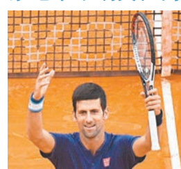
祖高域出線。

ATP蒙地卡羅網球大師賽，賽會2號種子塞爾維亞球星祖高域日前在第二圈賽事中，幾經苦戰下以6:3、3:6及7:5淘汰法國球手西蒙。7號種子米加爾意外輸盤數