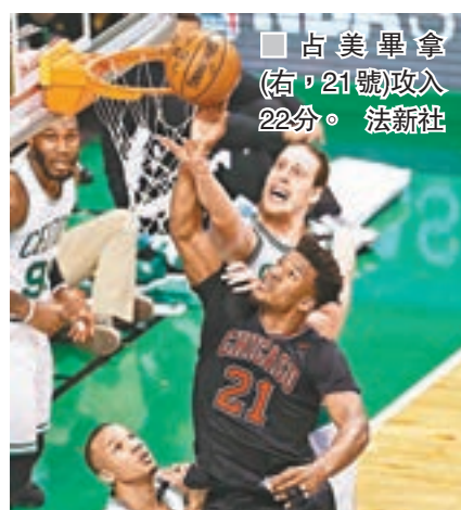
占美畢拿(右)21號攻入22分。