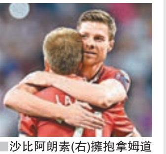
沙比阿朗素(右)擁抱拿姆道別歐聯舞臺。

另外，今仗亦成了拿姆和沙比阿朗素的歐聯告別戰。拜仁撰文向兩位已宣佈今夏退役的老將致敬：「阿朗素：126場歐聯，2005年(利物浦)、2014年(皇馬)冠軍；拿姆：113場歐聯，2013年(拜仁)冠軍。一個時代的結束。」