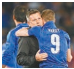
莎帥(左)與占美華迪的李城神話之旅告終。

這是馬體會4年來第3次殺入歐聯四強，其中2014及2016年闖進決賽都不敵皇馬屈居亞軍。主帥施蒙尼坦言要圓冠軍夢，「只能拼盡全力，一直努力，再努力。」 ■新華社