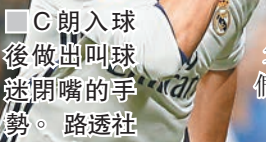
C朗入球後做出叫球迷閉嘴的手勢。路透社

上周首回合成為史上首位歐洲賽攻入100球的球員，C朗今仗次回合再憑三個入球，也成了歐冠盃/歐聯入球達100個的歷史第一人。儘管成績驕人，但C朗在比賽中還一度遭到挑剔的皇馬球迷之噓聲。賽後葡萄牙前鋒對此略有微詞：「我只想請求班拿貝的觀眾不要噓我，因為我總是在每場比賽中竭力奉上最好的表現，有時雖沒入球，但我永遠在努力幫助皇馬取勝。」對於C朗這番言論，皇馬主帥施丹認為球迷不會介意：「很少有球員能總在關鍵時刻出現，人們會感謝C朗在這裡所作的一切。」 ■新華社