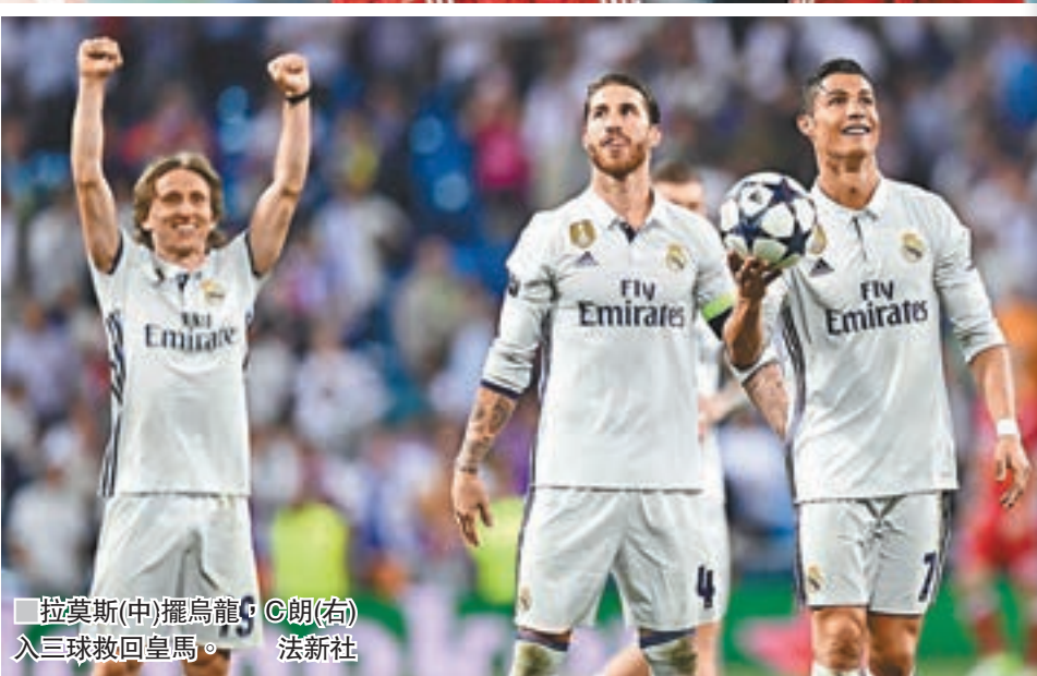
拉莫斯(中)擺烏龍，C朗(右)入三球救回皇馬。法新社

這場次回合比賽中，首回合入球卻射失12碼的智利中場維達爾，於拜仁領先2:1下卻領到第二面黃牌被罰離場，使德國班霸在加時少一人作戰。而C朗拿度在加時攻入兩球完成「帽子戲法」，但包括法新社在內的外媒認為，從慢鏡重播看，C朗加時的兩球都是越位。