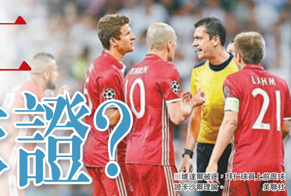
維達爾被逐，拜仁球員上前跟球證卡沙爾理論。

皇家馬德里在昨凌晨歐洲聯賽冠軍盃足球賽八強次回合，於加時後擊敗作客的拜仁慕尼黑4:2，總比數贏6:3，成為史上首支連續7年殺入四強之師。不過，球證幾次判決卻疑令西甲首都班霸的勝利陷入爭議，拜仁主帥安察洛堤抱怨，皇馬加時的兩個入球都是越位，認為歐洲足協應盡快採用錄影重播助判，增加公平性。