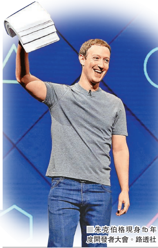
朱克伯格現身fb年度開發者大會。