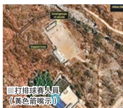
打排球賽人員(黃色箭頭指示)

另一方面，朝鮮發佈上星期六慶祝「太陽節」的影片，其中一段顯示最高領導人金正恩欣賞音樂劇，劇終時相關單位播放朝鮮2月試射導彈的片段，隨後接上其他導彈發射片段，顯示導彈飛越太平洋，在美國本土爆炸並燃起火球。在場所有人士隨即歡呼，金正恩則微笑揮手致意。