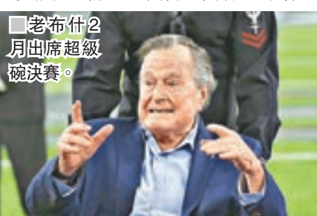
老布什2月出席超級碗決賽。