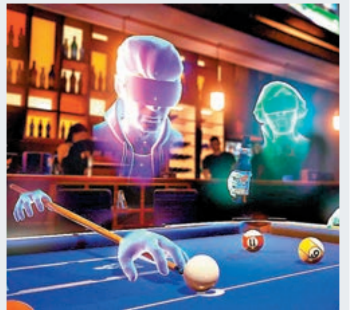
用家甚至可在Facebook Spaces與朋友玩桌球。

社交網站facebook(fb)年度開發者大會前日揭幕，創辦人朱克伯格宣佈，fb將趕上擴增實境(AR)潮流，開發以手機鏡頭為媒介的AR功能，將手機鏡頭變成AR主流平台。所謂AR就是把虛擬內容加到現實場景之中，早前掀起熱潮的「Pokémon Go」手機遊戲正是採用這種技術。朱克伯格認為AR現時僅屬起步階段，但它未來或可取代家居電器，譬如以應用程式代替電視。