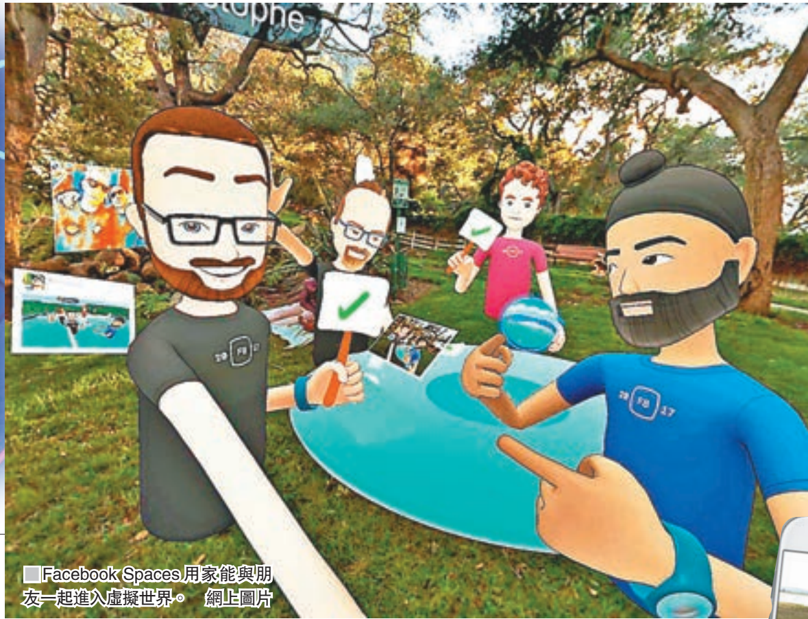
Facebook Spaces 用家能與朋友一起進入虛擬世界。