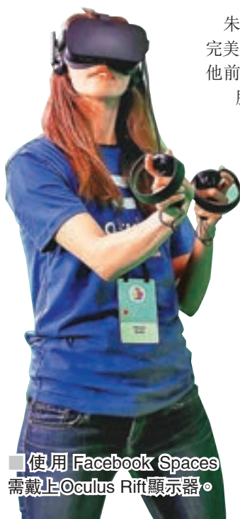
使用Facebook Spaces需戴上Oculus Rift顯示器。