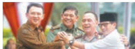
現任雅加達華裔省長鍾萬學(左)今與前教育部長巴斯威丹對決。

選前民調顯示，鍾萬學與巴斯威丹的支持率相差無幾。鍾萬學的支持率原先高達52%，足以讓他在2月的首輪投票中勝出，不過涉嫌褻瀆《可蘭經》事件令他遭到強硬派穆斯林猛烈攻擊，結果在首輪投票中，鍾萬學只取得43%選票，僅較巴斯威丹多3個百分點，兩人需要在今日的次輪投票決勝負。