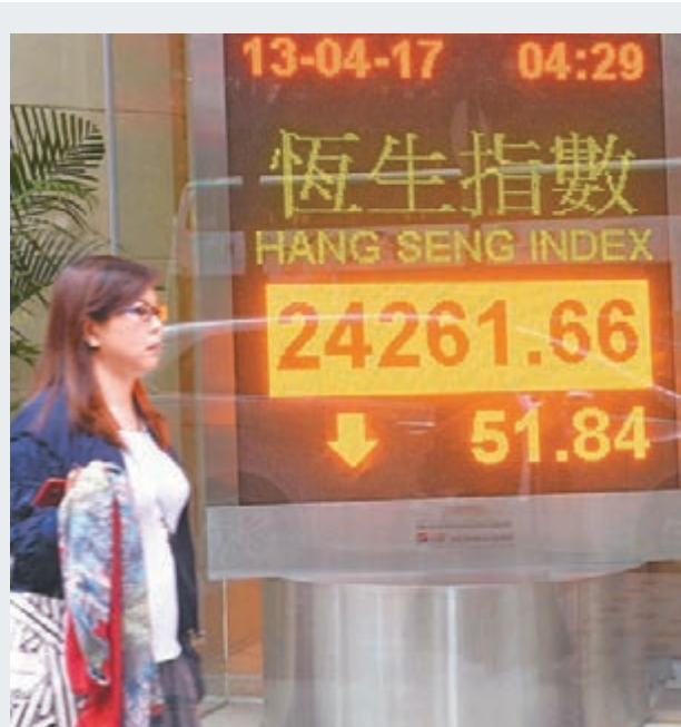
▲ 港股上周只有4個交易日，累計只跌6點。分析員普遍認為本周股市上落不大。