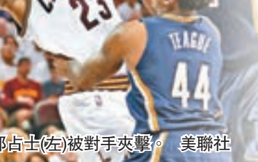
勒邦占士(左)被對手夾擊。

今仗也是勒邦占士生涯的第200場季後賽，同時也是他職業生涯季後賽首戰的第18連勝，賽後受前時淡定地表示因為邁奧斯最後一擊失手，因此他們獲得了比賽的勝利。