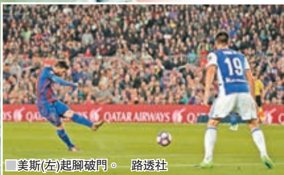
美斯(左)起腳破門。

開場僅14分鐘，希杭便率先打破僵局，克羅地亞鋒將確比單刀突入禁區墊射破網。3分鐘後，艾斯高在禁區內連過數人後破